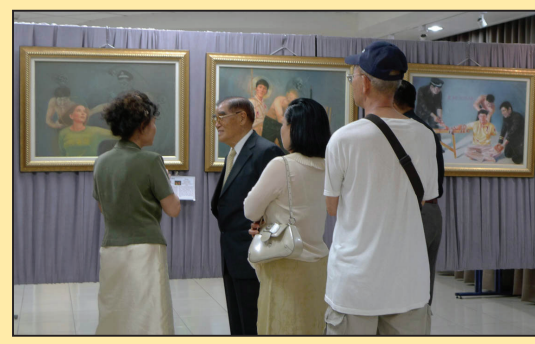
将军：每幅画作都让人深受感动(第七版)