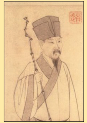
苏东坡的生命轮回(第八版)