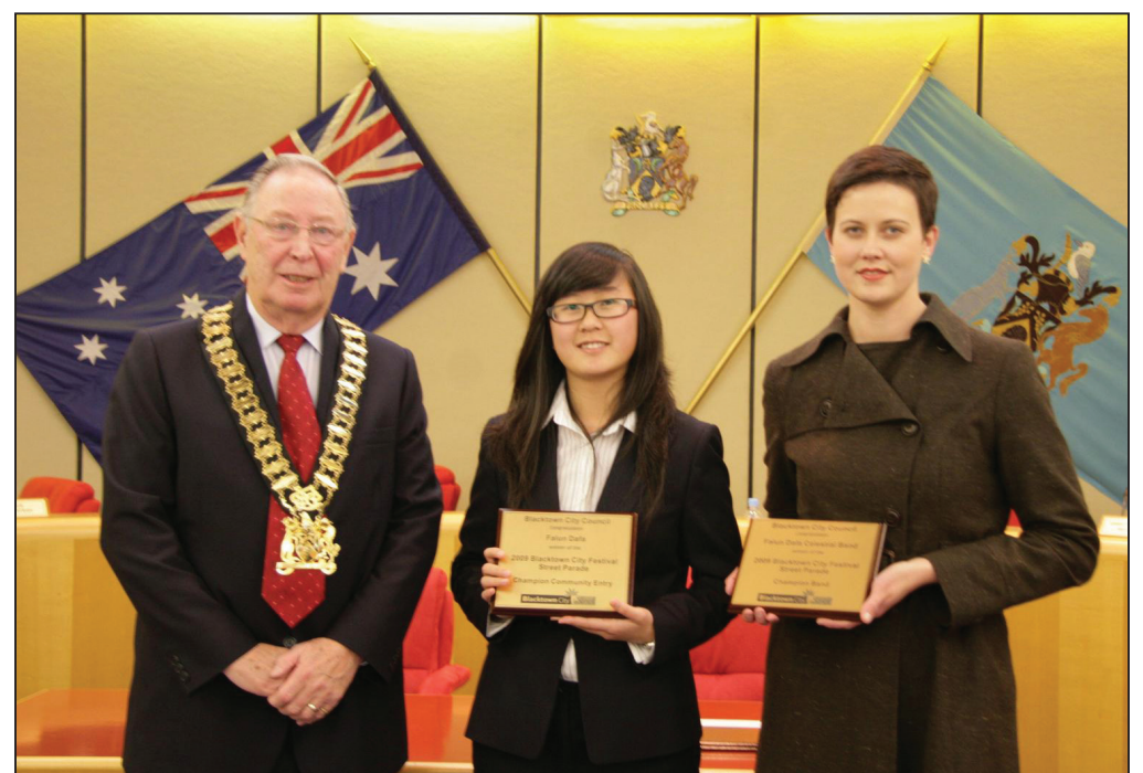
图：布莱克镇市长(左)向法轮功团体代表颁奖

法轮大法，又称法轮功，是传统的修炼方法，以“真、善、忍”为准则，包括缓慢的炼功动作和打坐。法轮大法于一九九二年在大陆传出，现在已经弘传于世界一百多个国家。有当地居民说：“如果人人都按照‘真、善、忍’的原则做事情，这个世界就太太好了”。