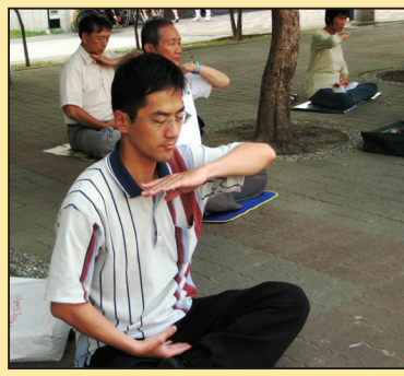
俗世洪流中不迷失的经纪人(第四版)