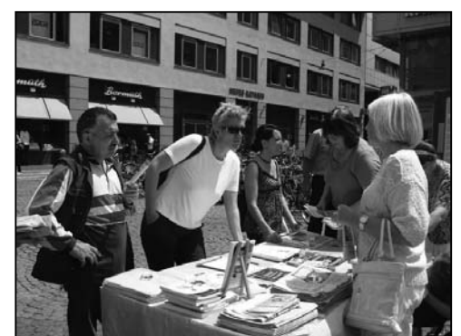
图：民众了解法轮功真相

她说她很了解共产党的那一套，但还是没想到，在中国居然会有这么多的活体摘取法轮功学员器官的事情。她说她的男朋友经常去中国，她要把这些信息告诉他。