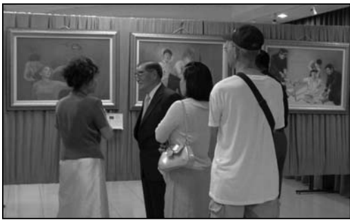
图：高海翔中将（着西装者）很认真、专注地听导览人员的解说

不同于一般的画作，这是由一群来自不同背景、修炼法轮大法的艺术家们所创作，以艺术表现对人生真谛的追求，对神的赞美，以及善恶正邪。展出的四十多幅画作，有的颂扬生命之美：妈妈抱着熟睡的婴儿在灯下阅读、法轮功学员打