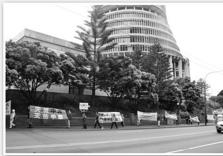
图：2008年二月15日，新西兰首都惠灵顿，举办了500万勇士退出中共组织的声援集会游行活动。

五千多万中华儿女脱离邪党、走向光明的退党洪势，可谓精神觉醒、道德复苏的正义之举；这股退党大潮雷霆万钧之势，也会使残存的中共党员深思未来。五千万多人退党的里程碑已敲响中共丧钟，这鲜明地标志着：中共退出历史舞台之日即将来临。“没有共产党，才有新中国”，笔者呼吁中国同胞在这非常关键的历史时刻，抓紧难得的机缘，广传《九评》、力促「三退」，早日迎来天灭中共、诞生新中华的一天。