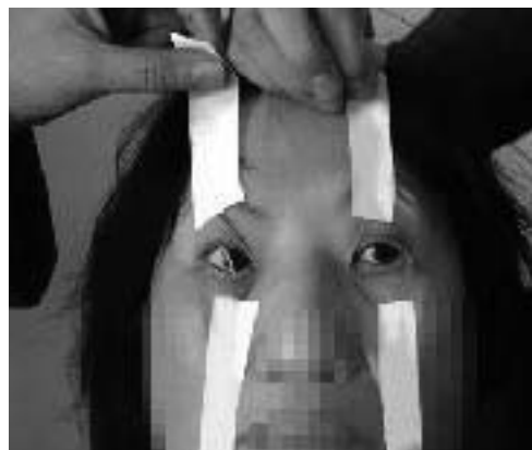
演示图：用胶带纸粘在眼眶周围上下拉扯不让睡觉