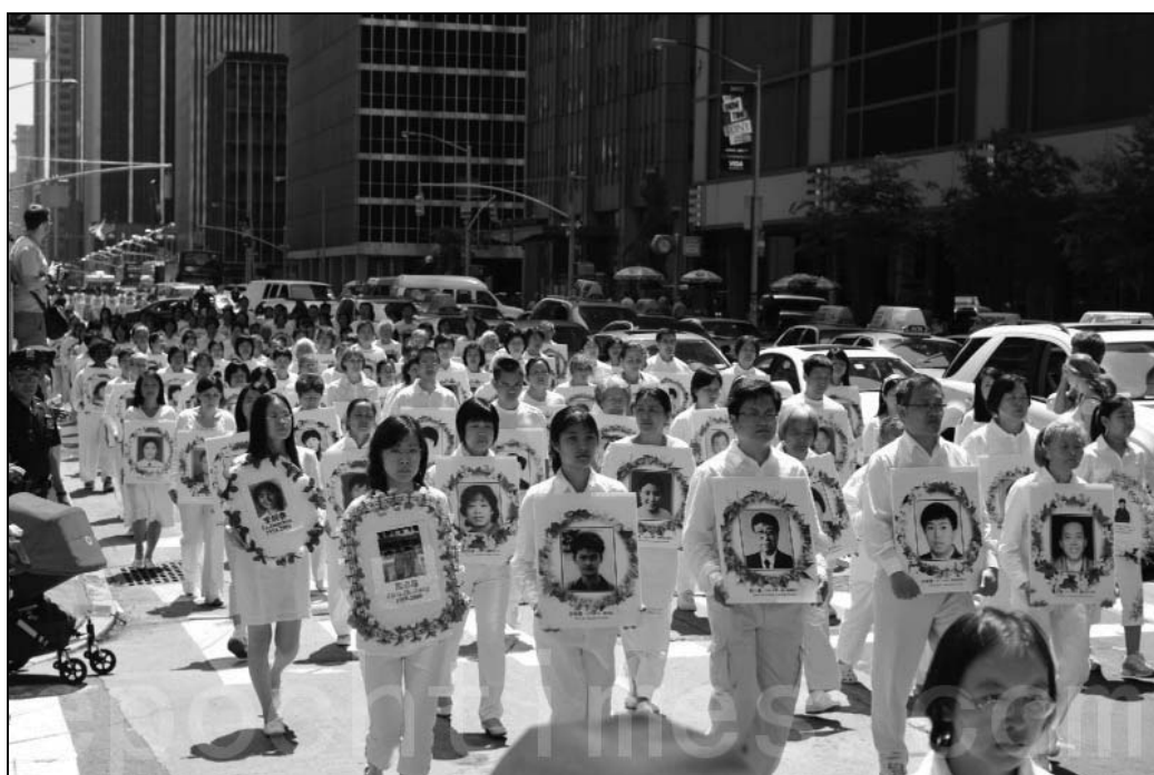
图：2009年6月6日法轮功学员在纽约曼哈顿游行呼吁停止迫害，图为游行队伍的局部。