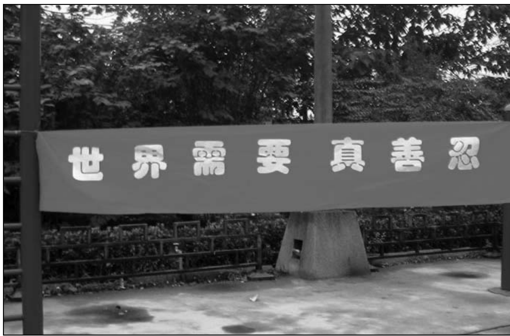
图：零七年七一前夕河北某地法轮功学员在公园悬挂的真相横幅

早在一九四八年，当时的国民政府山西省主席阎锡山说：“共匪是最能迷惑人的九尾狐狸精。”在迫害法轮功中，中共靠其长期的党文化洗脑和信息封锁，通过其一言堂的媒体抹黑法轮功，欺骗和迷惑了全世界各国人，尤其是中国人。明慧网不仅破除中共的各种谎言与栽赃诬陷，而且是揭露迫害的主要资讯来源。