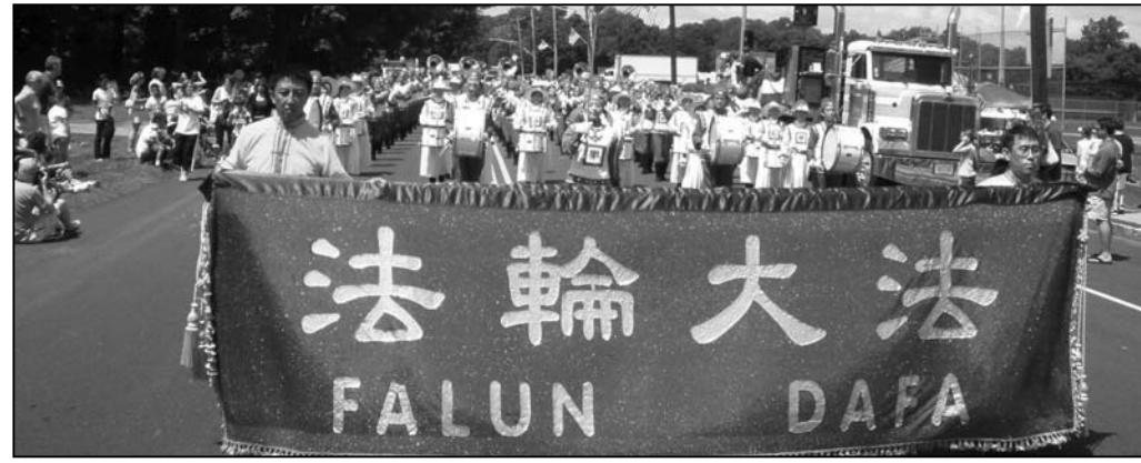
图：天国乐团通过观礼台