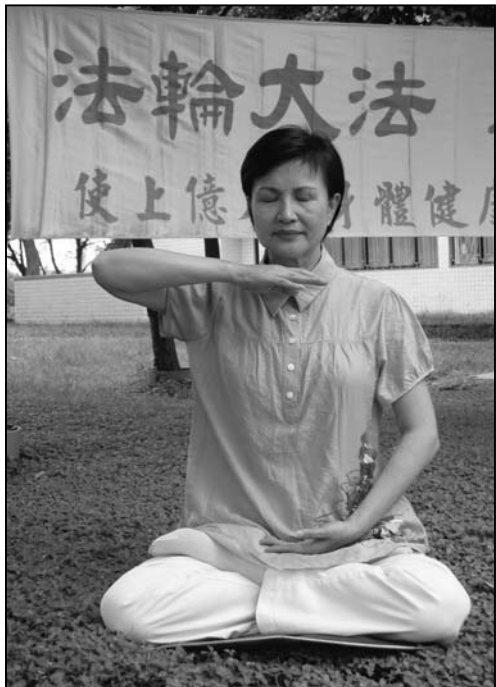
图：修炼法轮功的廖女士神清气爽，很难让人相信她已经六十三岁了。

己的修炼状态不稳，或讲真相遇到瓶颈，她会看明慧网上大法弟子的修炼体会，常常就会看到和自己状态相似的心得，就在这样无声的交流平台中，她很快找到问题症结，又回复到修炼人该有的精神风范。她说：“没有明慧网，我无法做的很好。”