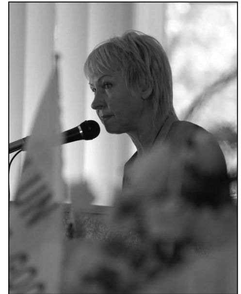
图：乌克兰学员分享自己修炼法轮大法的心得

六月二十一日，参加法会的学员们在第聂伯彼得罗夫斯克市举行了游行。队伍以“法轮大法好”横幅领头，乌克兰语版的