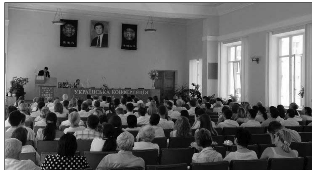
图：二零零九年乌克兰法会在第聂伯彼得罗夫斯克市召开

正法修炼，我们已走过整整十个年头了，从各地证实法的实践来看，明慧网在救度众生中，所起到的作用是非常巨大和深远的，从根本上说，这是师父和大法的力量，同时也是明慧编辑部和大陆大法弟子整体配合的结果。