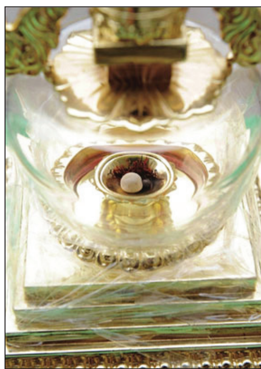
图:原存尼泊尔蓝毗尼中华寺的释迦牟尼佛舍利,现供奉在张家界市天门山寺。

“陕西扶风法门寺的释迦牟尼佛指骨舍利(1987年发现);北京灵光寺招仙塔的释迦牟尼佛牙舍利(1900年发现);北京房山云居寺雷音洞的释迦牟尼佛舍利(1981年发现);镇江甘露寺铁塔的释