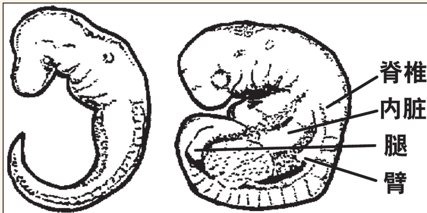
海克尔对人的胚胎图作了艺术加工,去掉了人胚胎的内脏部分和腿。