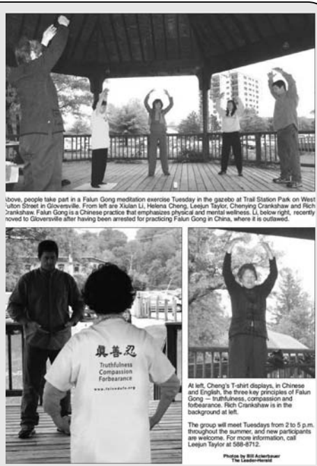
图：《The Leader-Herald》图片文章《西福顿街上的东方文化》