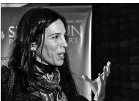
图：著名舞蹈演员宝拉·罗布里斯