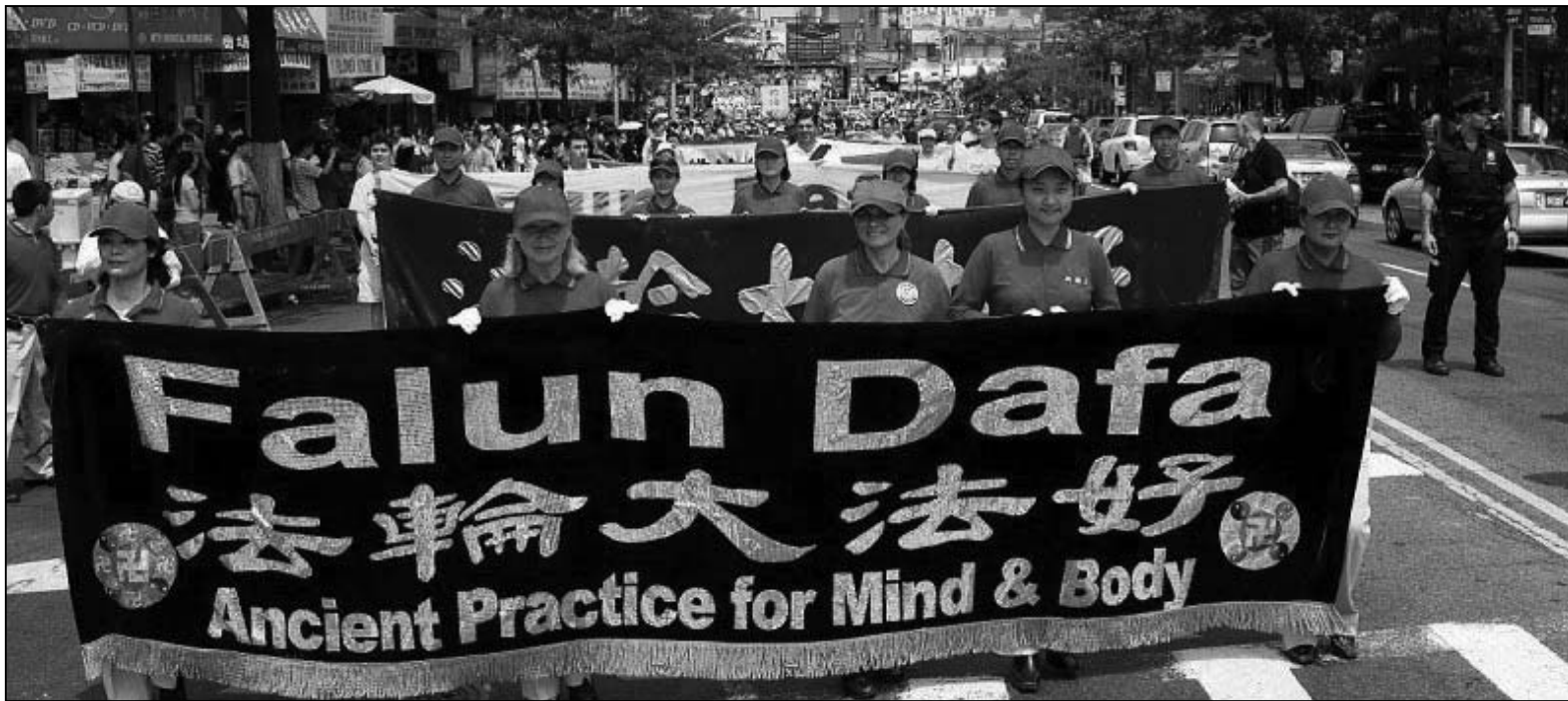
图：他们历经十年霜雪，为告诉人们一句真言：「法轮大法好」，在天灭中共之际，退党保平安。图为2009年6月法轮功学员在纽约的一次游行。

另一方面，中共对民众认识法轮功和迫害真相设置了种种障碍，不惜赤膊上阵，从二零零一年自编、自导、自演的所谓「天安门自焚事件」，到二零零八年，收买组