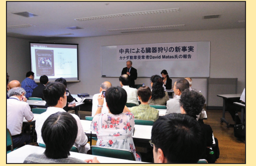
国际人权律师：每个人都有责任制止罪恶(第七版)