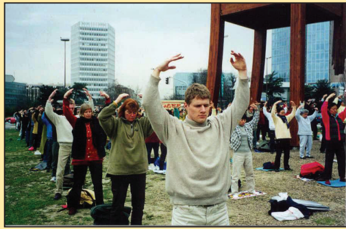
“法轮大法究竟是什么？”(第三版)