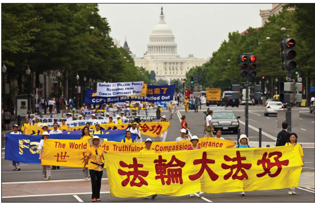
图：华盛顿DC宾夕法尼亚大道上的法轮功盛大游行

继十六日的各界集会和烛光守夜之后，法轮功学员们十七日上午九点半，在美国国会山庄西草坪上开始了千人大型炼功；临近中午时，由穿蓝白色制服的天国乐团开道，数千人的游行队伍从国会山庄前的国家公园出发，一直到白宫附近的自由广场。