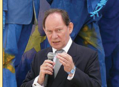
欧洲政要支持法轮功(第七版)