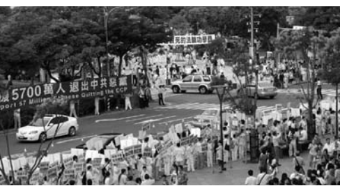
图：中国大陆游客在台北一零一大楼前看法轮功游行队伍