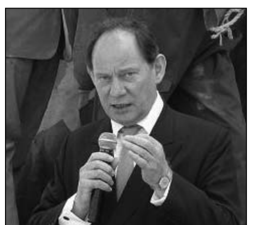
图：欧洲议会副主席爱德华·麦克米兰-斯科特先生

欧洲议会预算控制委员会副主席、比利时籍绿党议员巴特·斯泰斯先生(Bart Staes)致函说，“我的心与那些为了坚定、忠诚地修炼法轮功而遭受极大迫害压力和献出了生命的修炼者在一起。”“近来，移民官在