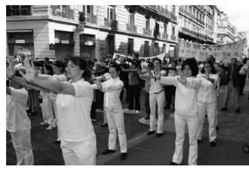
图：在中共驻马赛中领馆前展示第一套功法