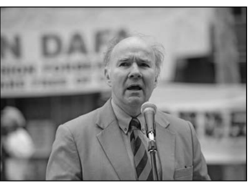
图：澳洲民事委员会主席彼得·威斯特摩

“完全出乎我的意料，仅仅一分钟后，我就上到一个中国医院的网站，网上正是肾移植的广告，只要一星期即可，还有肝，心和肺的移植。在澳洲这样的国家，移植器官需要几年的等