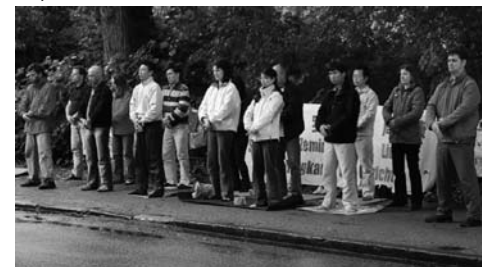
图：德国汉堡法轮功学员在中领馆前抗议中共十年迫害