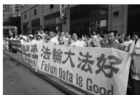
图：法轮功学员在纽约中领馆前集会，呼吁制止迫害。