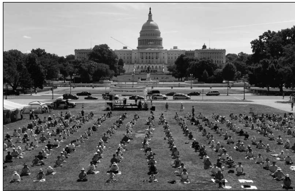
图：法轮功学员在美国国会山国家广场大草坪集体炼功

二零零九年七二零法轮功反迫害十周年之际，世界各地的法轮功修炼者纷纷举办活动，谴责中共十年迫害，呼吁各国民众和政府和他们一起为制止中共的暴行而努力。