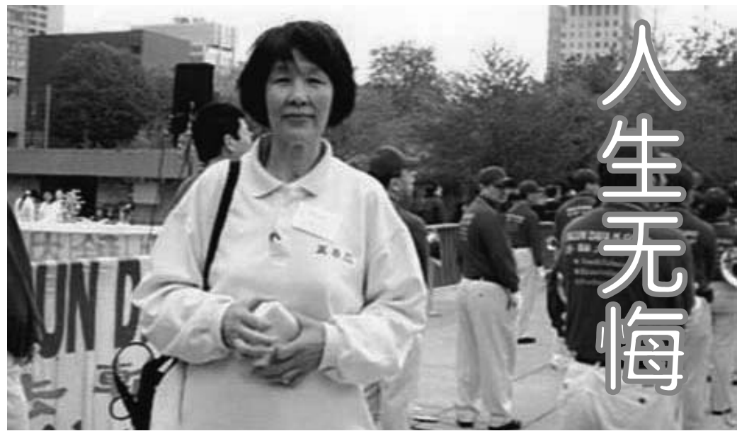
图:金菊在多伦多“世界法轮大法日”集会上

网络版《法轮大法大圆满法》请见: http://www.falundafa.org/book/chigb/dymf.htm