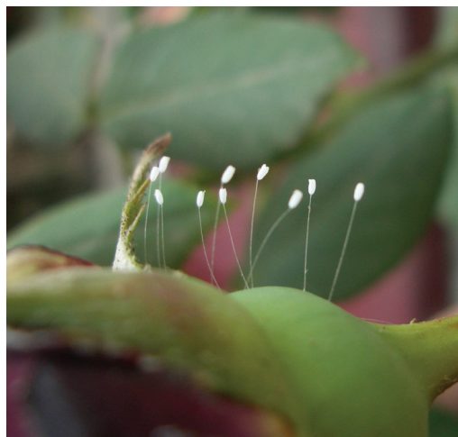
图：山东烟台某幼儿园内的月季花丛中，发现有7处，约二十余朵的优昙婆罗花。