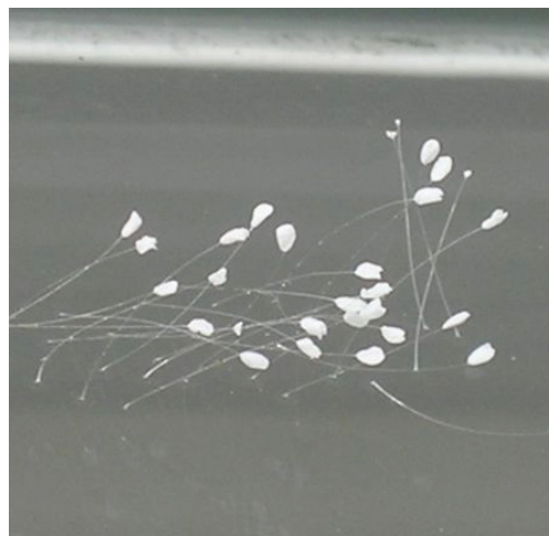
图：台湾嘉義民雄國小的一間教室的玻璃門上開了28朵優曇婆羅花。