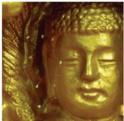
图：须弥山禅院的佛像上长出的优昙婆罗花。