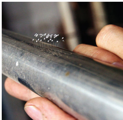
图：长在钢管上的优昙婆罗花。