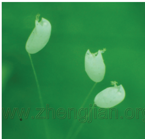
图：放大后的优昙婆罗花外型如钟，花瓣、花心清晰可见。