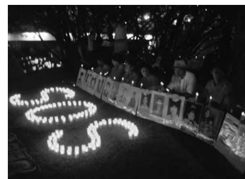
图：烛光悼念被中共迫害致死的中国同修

清晨六点，法轮功学员们来到了集会现场——和平公园门前，向众多的与会者发放法轮功真相资料，讲述发生在中国的迫害详情。上午，学员们在原爆遗址周围讲真相。一位来自中国的留学生，来日本之前在中国是从事警察工作的，当他了解了真相后，用真名退出了