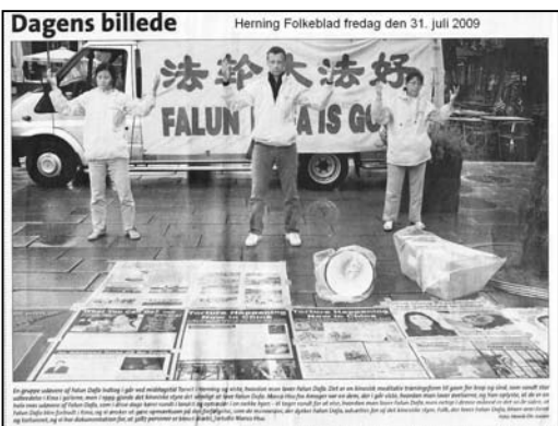
图:丹麦媒体Herning Folkeblad报导法轮功

文中写道:法轮大法修炼者组成的一个小组,昨天中午来到Herning城市的广场,展示法轮大法的五套功法。这是一种中国的打坐修炼的功法,有益于身体和精神的健康。在九十年代,法轮大法在中国迅速发展。但是在九九年,中国(共)当局禁止人