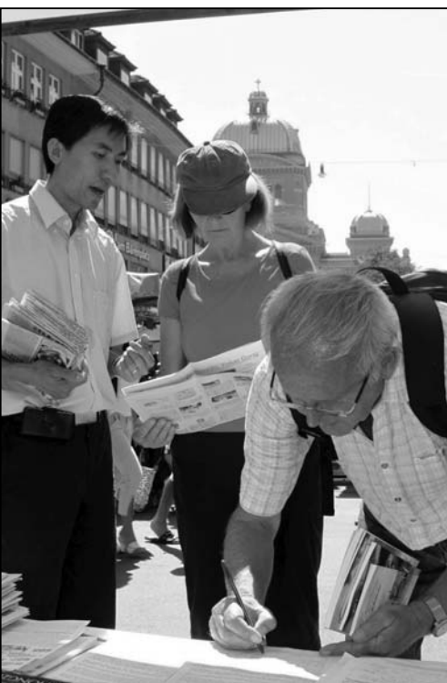
图:民众签名支持法轮功反迫害

一位华人在摊位前看到活体摘除法轮功学员器官的图片后问:“这些都是真的吗?”学员告诉他:这是真的。加拿大前政要大卫·乔高和国际人权律师大卫·麦塔斯经过了大量调查,发现中共当局活体摘除法轮功学员器官,牟取暴利的罪行是大量真实存在的;他们最终的结论是:这种罪行是这个地球上从来没有