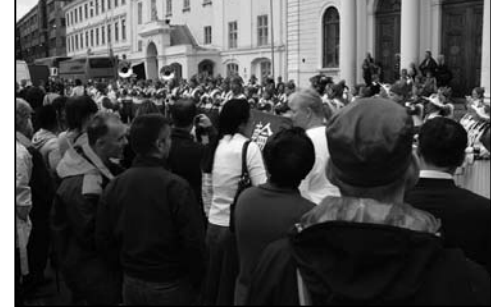
图:瑞典民众驻足观看天国乐团的表演

法轮功学员的游行队伍经过哥德堡的最繁华地区。尽管天上下着阵阵小雨,人们依然纷纷驻足观看游行;欧洲天国乐团的演