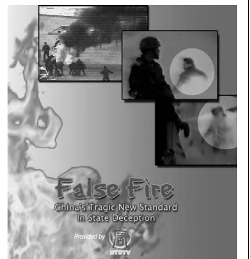
图：分析2001年北京天安门自焚事件的影片《伪火》(False Fire)获第51届哥伦布国际电影节荣誉奖。

邪教最可怕的地方是什么？就是对人的控制。你要是不炼法轮功了，法轮功能强制你下岗吗？能让你不得升学提干吗？能强迫你参加“学习班”吗？能把你关起来强制洗脑吗？能强迫你“转化”吗？能用株连手法把你