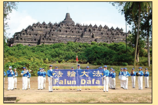
迎国庆 印尼日惹市清天国乐团演出 (第七版)