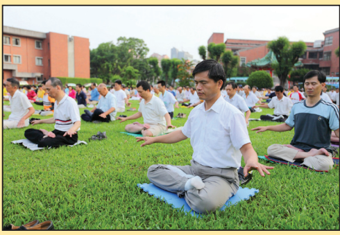
家庭因修炼更幸福 (第二版)