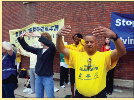
蹉跎四年后的感慨 (第二版)