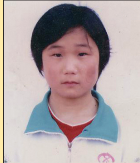
女中学生被囚洗脑班近一月 (第四版)