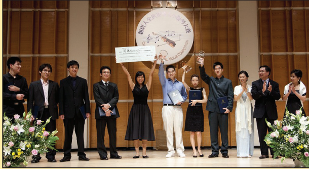
全世界华人小提琴大赛圆满落幕 (第七版)