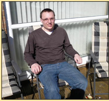
摆脱了抑郁 生活更光明(第二版)