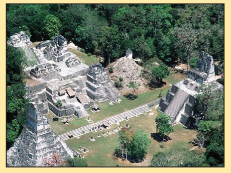
天数茫茫谱春秋 世道兴衰有定数(第八版)