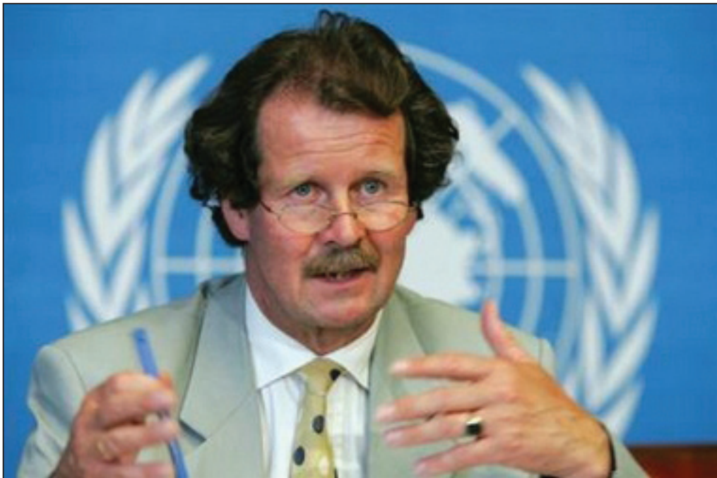
图：联合国酷刑问题特派专员诺瓦克先生(Manfred Nowak)

美联社、路透社、法新社、中央社等国际主流新闻社，以及纽约时报、法国国际广播电台、美国之音、新西兰电视一台、加拿大新闻、德国之声等世界主流媒体，都在第一时间作出报导。