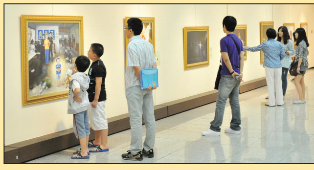
真善忍国际美展引起韩国大邱市民共鸣(第七版)