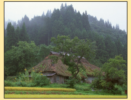
【古代诗人与修炼】陶渊明(第五版)