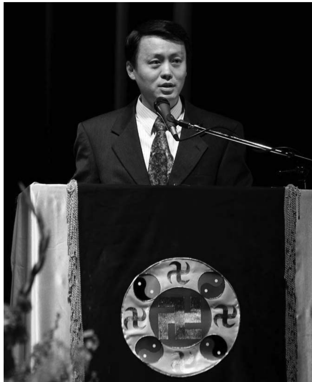
图：法轮功学员交流修炼心得

法轮功受到如此大的非难，还在坚定的向世人讲述着迫害的真相。这样一群严格按照真、善、忍的标准修炼自己心性的普通人，他们什么时候能受到公正的对待啊？