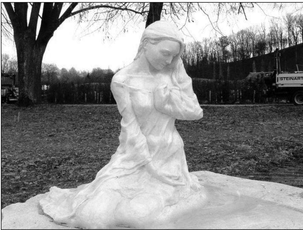
上图：优汉娜的作品引来了有缘人