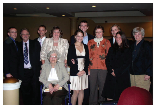
图：老少十一口在观看神韵演出后开心的合影

索耶女士表示在观看表演前，就听朋友谈到过中国大陆发生的对信仰的迫害，这次在神韵表演中，看到《迫害中我们屹然