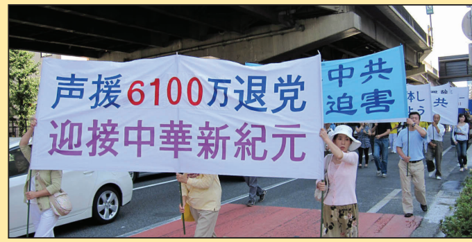
东京游行声援六千万勇士退出中共(第七版)