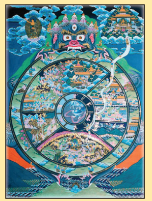
轮回转世说缘分(第八版)