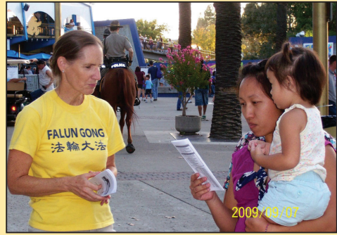
在加州博览会介绍法轮大法(第二版)