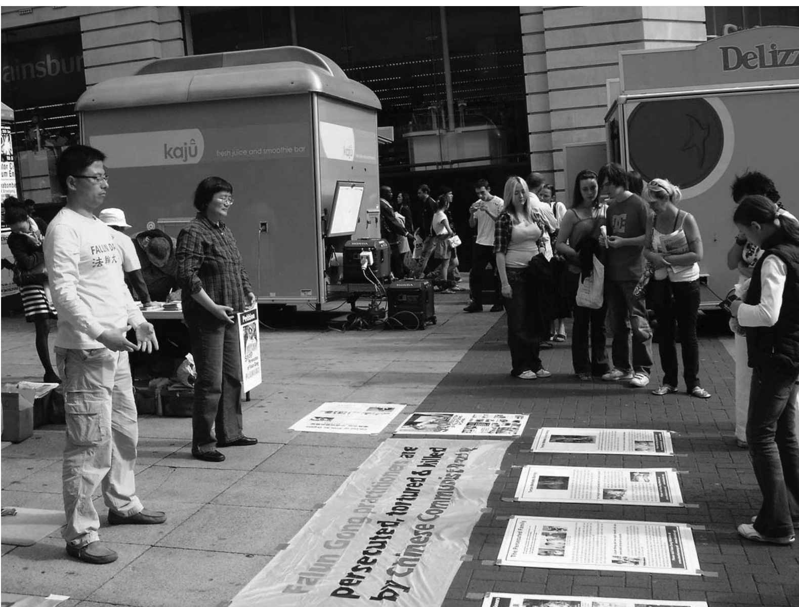
图：路人关注法轮功真相

很多中国大陆同胞也凑到展板周围观看，拿资料，并有五十二位中国大陆同胞声明退出中共的党、团、队。