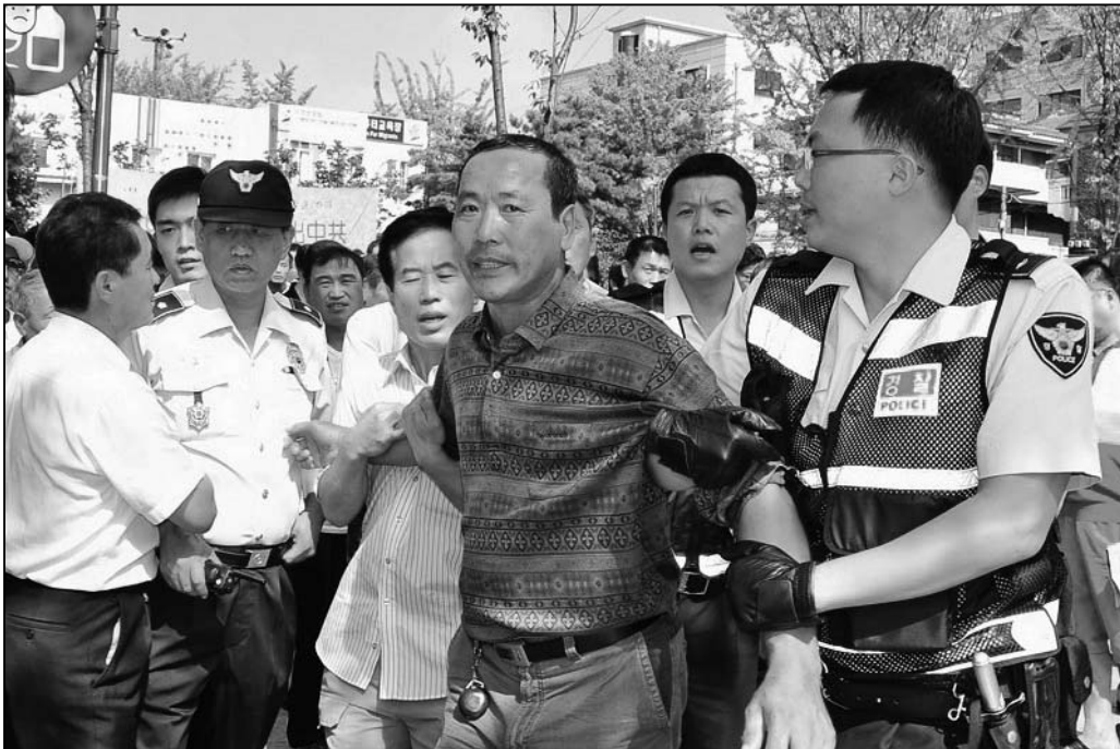
图：9月13日，过百名华人暴徒殴打了参加“六千万人退出中共声援大会”的游行人士，并且毁损了相关器材，部份暴徒被警察押往警署。

参与有目的的政治活动早已不是新闻。远的有当年迫害法轮功的元凶江泽民到海外时当地领馆花钱买人欢迎的旧事，近的有纽约中领馆总领事彭克玉亲口承认法拉盛事件是