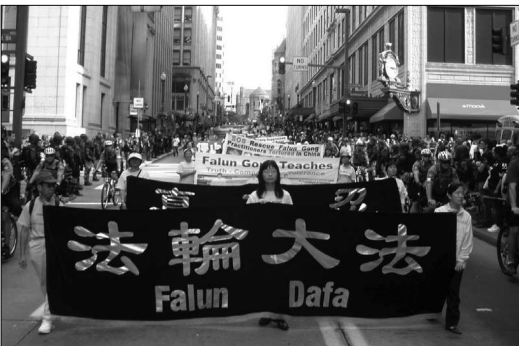
图：法轮功游行队伍

当日下午，历时三个小时的游行，法轮功学员给人们展示了与一般团体截然不同的面貌。色彩庄重、明快的“法轮大法”、“真善忍”、“法轮大法好”等大法横幅和优美的功法演示图片，清楚地告知人们法轮功的美好；法轮功学员遭受各种迫害的图片明确的揭露中共的邪恶；“停止迫害法轮功”、“停止非法抓捕法轮功学员”、“法办江泽民、罗干、周永康、刘京”等横幅表达了法轮功学员的基本诉求。