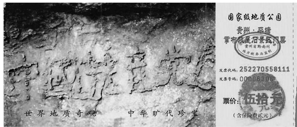
图：以「中国共产党亡」为背景的平塘地质公园「藏字石」景区门票