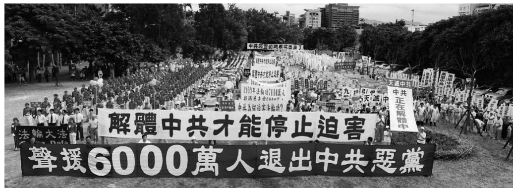
图：来自台湾中、北部各地约两千八百多名民众声援六千万勇士退出中共邪党

加拿大自由媒体（Canada Free Press）和良心媒体（Media With Conscience）当天也作了报导。自由媒体报导说，加拿大外交部长坎农（Lawrence Cannon）表示，加拿大政府非常关注中国的人权问题，包括法轮功学员受到的虐待。加拿大政府要求中共当局根据《世界人权宣言》第十八条，保证所有中国公民的信仰自由。加拿大政府同时要求中共释放那些因实践信仰自由而受到关押和监禁的中国公民，包括法轮功学员。