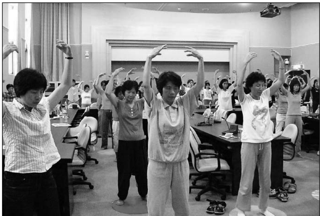
上图：教师研习营参加人数众多

研习活动，有专业背景的学员精彩的讲座，还有学炼五套功法，每次活动下来，都有许多教育界的同仁得法。婉瑛看在眼里，心里很高兴。尤其看到教师们纷纷购买《转法轮》一书，她为这些教师们看到了法轮功的好而感到欣喜，因为自己当初也是读了《转法轮》才有机缘了解法轮功。（明慧记者唐秀明英国伦敦报导）二零零九年九月中旬的周末，伦敦摄政公园法轮功炼功点（义务教功点）来了几位新学员，他们都是最近刚刚在英国法轮功学员的讲真相活动接触到法