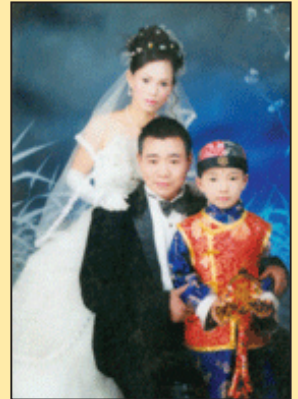
月圆之夜 (第六版) 亲人何方?