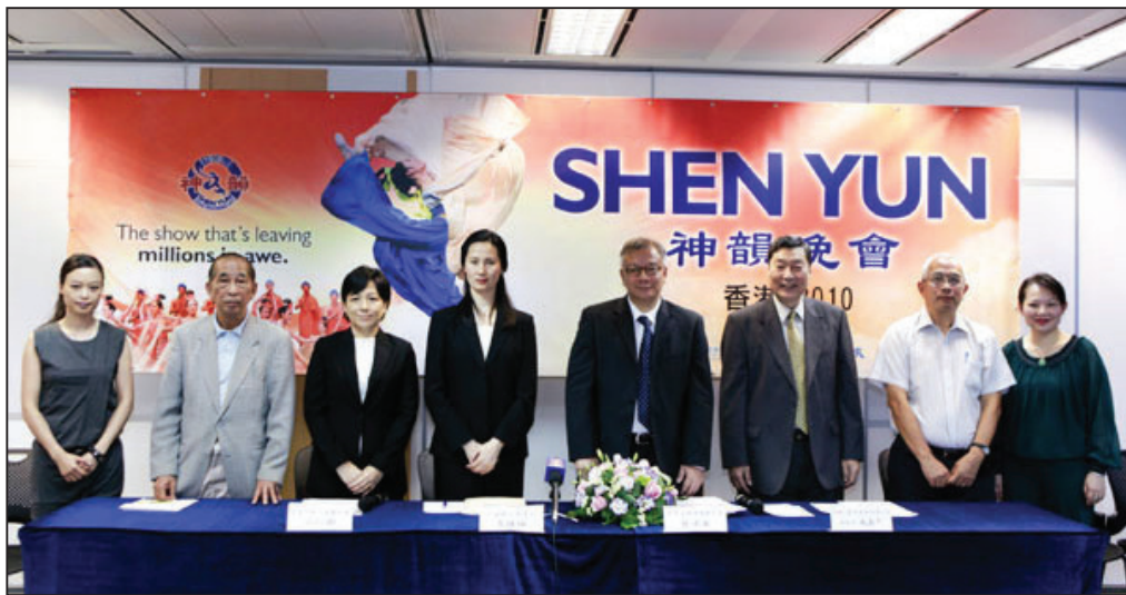
图：十月四日在香港举行的神韵晚会介绍会，宣布神韵艺术团将于明春光临香港。

来香港，作为言论自由和文化交流的机会，美国神韵艺术团是国际级的表演艺术团，而且里面带有很多中国的传统文化、信仰文化，让港人大开眼界，并有很好的欣赏艺术的机会。