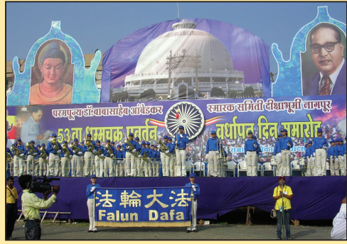
天国乐团光耀印度佛教庆典（第七版）