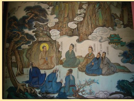
丘处机和马丹阳的修炼故事（第八版）