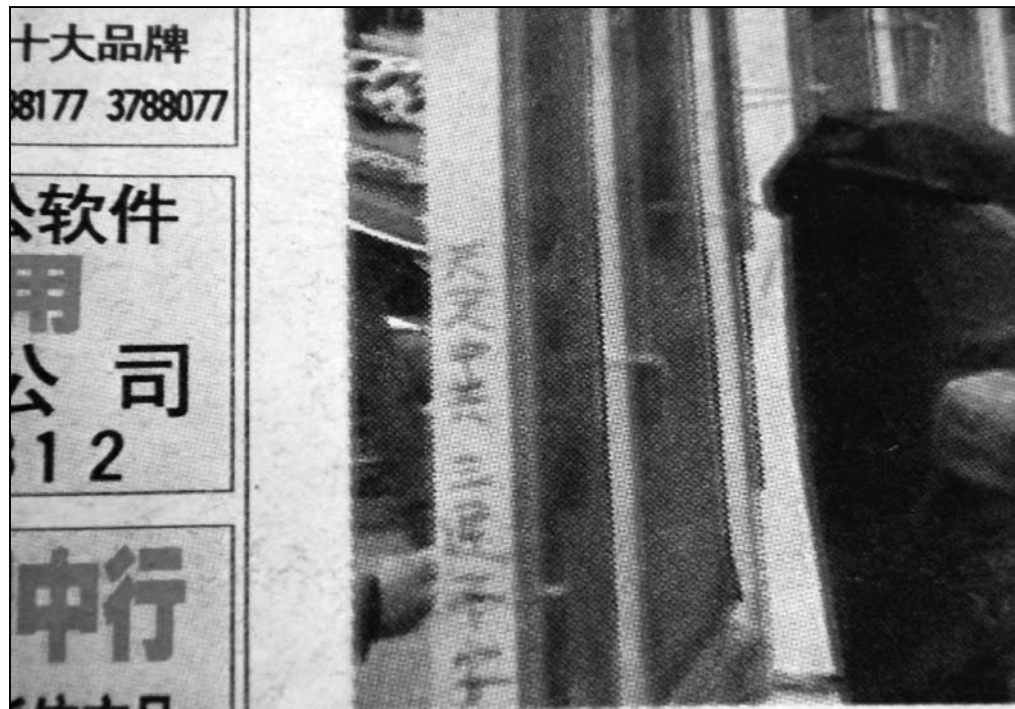
图：9月27日出版的辽宁省锦州市的《锦州晚报》头版图片惊现“天灭中共”字样。

为了在国际上往自己脸上贴金，还在西方国家的政府要地、名胜等地集会，升旗，到处招摇、献丑。在白宫前的升旗仪式上，血旗三升三降，可谓丢盔卸