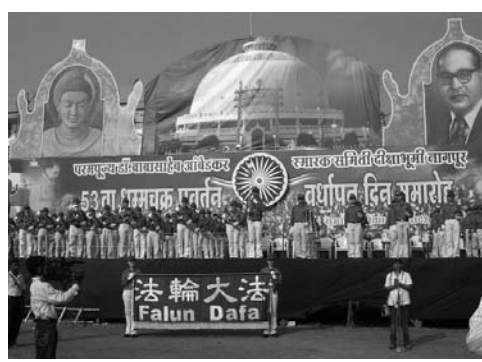
图：天国乐团在印度佛教庆典上表演

随后，天国乐团在庆典中心舞台上一字排开，让人眼睛为之一亮。演奏时，乐声响彻云霄，观众目不转睛，当地高僧也前来观赏。