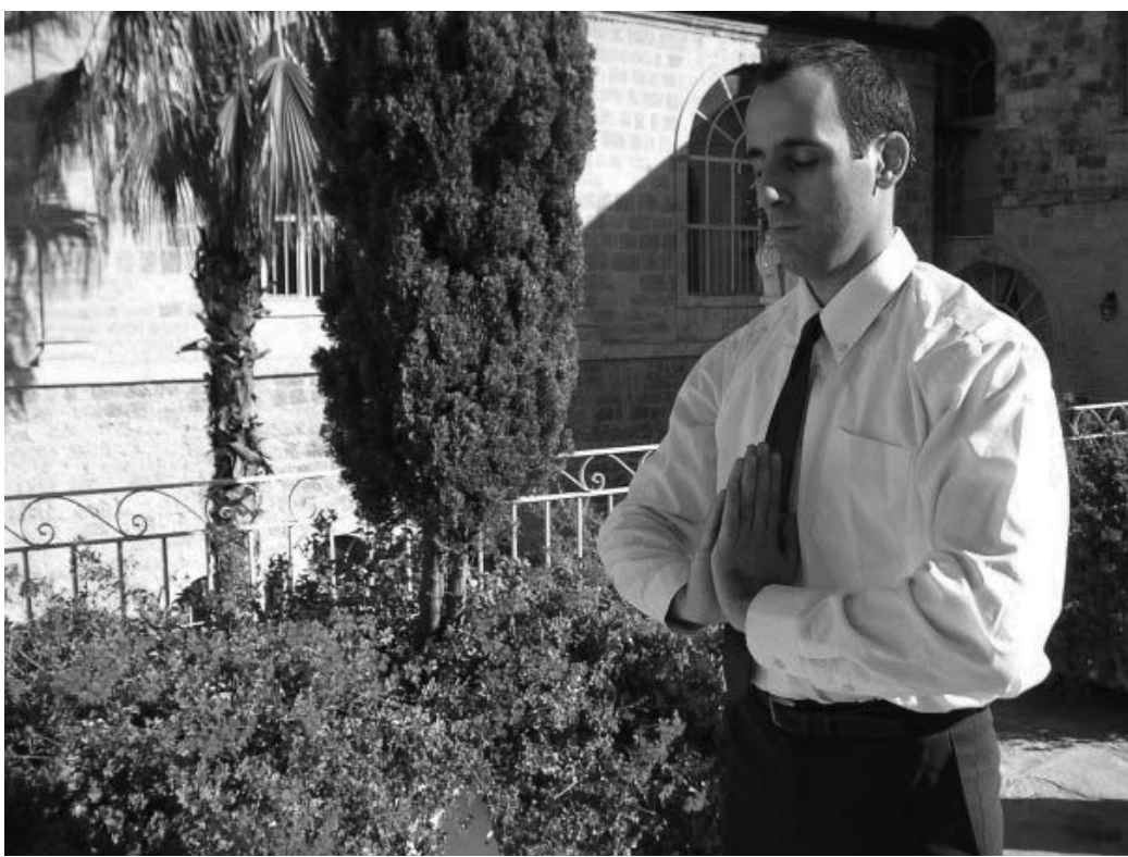
图：欧哈德在修炼法轮功后不仅得到了身体的健康，也找到多年心中困惑的问题的答案

从炼功点回来后，欧哈德购买并阅读了《中国法轮功》，在同一天，他从网上下载、并开始阅读《转法轮》一书。他说：