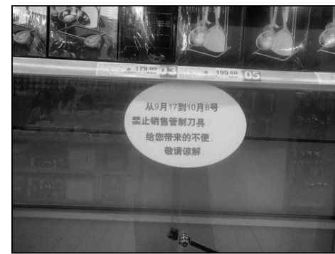
图：十一期间民用刀具在北京成为受管制物品

中共这样提防着老百姓，把中国人都当成什么了。蹂躏了人民几十年后，反过来还把中国人象贼一样看着。中共可不只是对自己的心脏部位如此的戒备森严，采取种种管制手段，对那些出境探亲的国人，中共也是层层检查，唯恐放过去一张它认为不