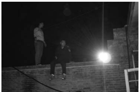
图: 蓟县涇溜派出所的警察在深夜企图私闯民宅

(明慧通讯员天津报导) 住宅本是公民的私人领地, 受法律保护, 可是天津蓟县涇溜派出所的警察们却执法犯法, 在深夜企图私闯民宅, 因家中三个女孩向邻居们呼喊求助, 警察才未敢跳进院子。