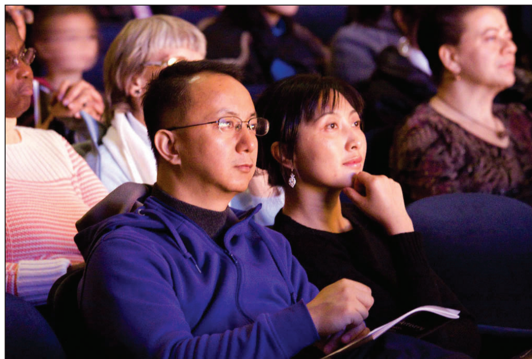
图：多伦多神韵晚会观众