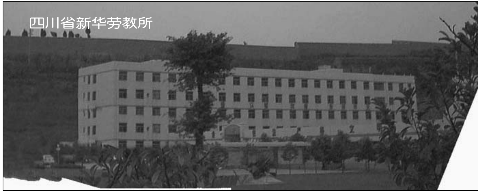
四川省新华劳教所

在新华劳教所的《包夹手册》中，要求贴身包夹，严防死守，以将“人防”的作用力争发挥到极限。具体职责包括“四陪”（陪吃、陪住、陪学习、陪行动），“四防”（防逃跑、防绝食、防炼功、防手势眼神）等。包夹人员分布位置从“一包一”到“四包一”、“多包一”。包夹的重点环节是开会、劳动、学习、集合、就餐、活动、训练、行进、就医、解手等时候。《包夹手册》还明确指示“应急防控”，在法轮功学员呼口号、炼功、绝食、串联、聚会、散布言论等不配合中共迫害的行为时，包夹人员要及时捂嘴，并从前、后、左、右，紧抱其躯体并就地压下制服，邻近的其他包夹人员要及时全力协助采取强力控制措