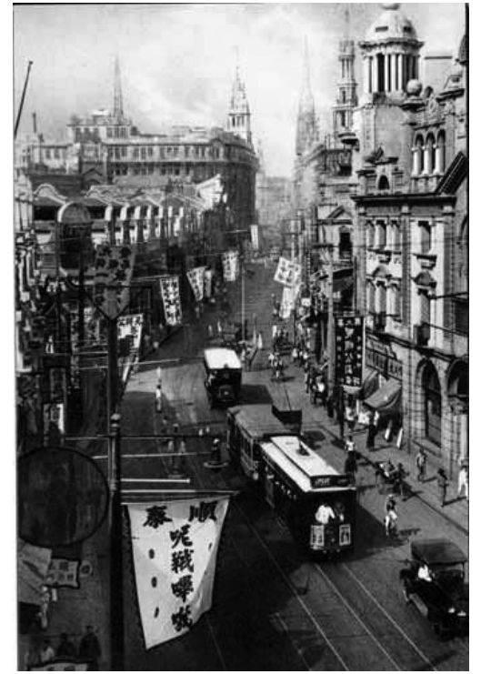
图：民国时期GDP占世界总量的12%，图为民国时期的上海街道。

过去中共讲“只有社会主义才能救中国”，现在只讲“没有××党就没有新中国”了。在1957-1976年中共大搞社会主义的20年里，中国人均GDP年增长率为2.9%，在1978-1999年搞市场经济、实际上也就是搞资本主义经济的20年里，中国人均GDP年增长率为7.8%（这是中共抛出的数据，是有水分的）。这不是在说明“只有资本主义才能救中国”吗？那么如果这三十年没有中共难道中国就不会搞市场经济了吗？