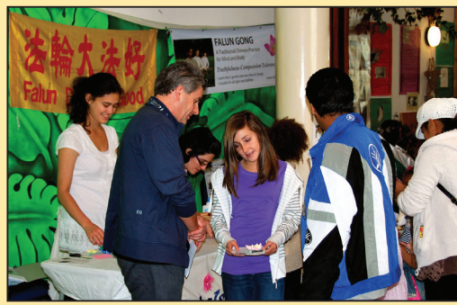
“普利茅斯尊重节”上的圣洁莲花 (第七版)