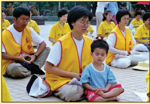
崭新的人生 (第二版)