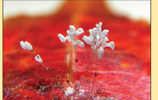
圣缘一瞬间 (第八版)