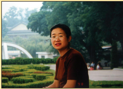
大连水产学校讲师再次被非法劳教 (第四版)