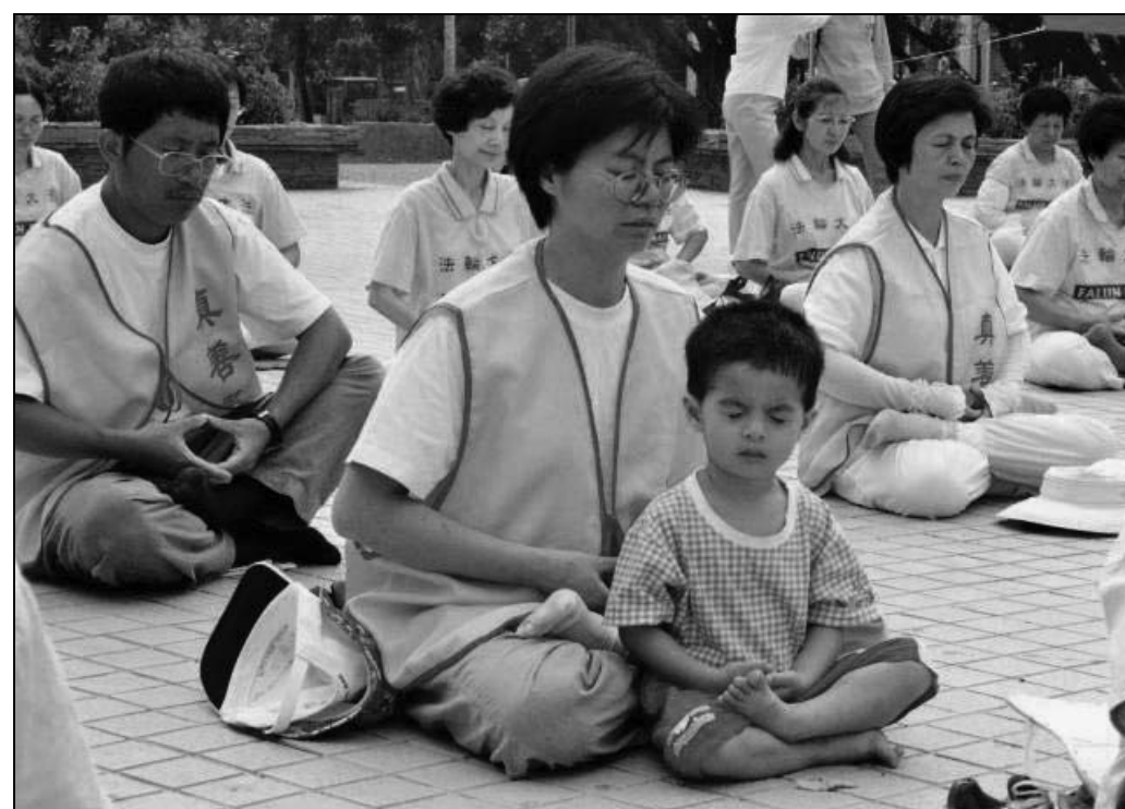
图：余女士与小儿子一同参加法轮功炼功弘法活动

没修炼时，余女士和女儿间的亲子关系比较紧张，学法后，她不再以母亲的权威去改变女儿。每每意见不同，她会想是否自己没能站在孩子的角度为她设想，不同以