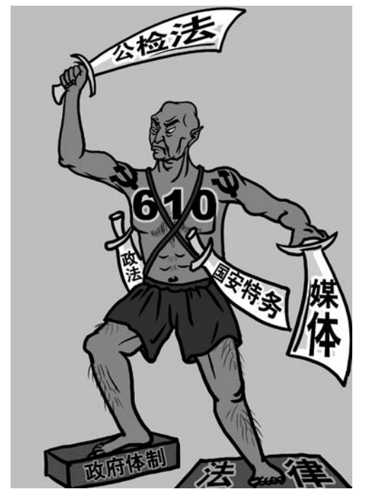
图：超越法律之上的“610”

中共青岛市委于2009年2月27日下发文件（青办发〔2009〕3号）到各区、市党委，市委各部委，市直各党委（党组），中央、省驻青各单位党委（党组），青岛警备区党委，要求加强迫害法轮