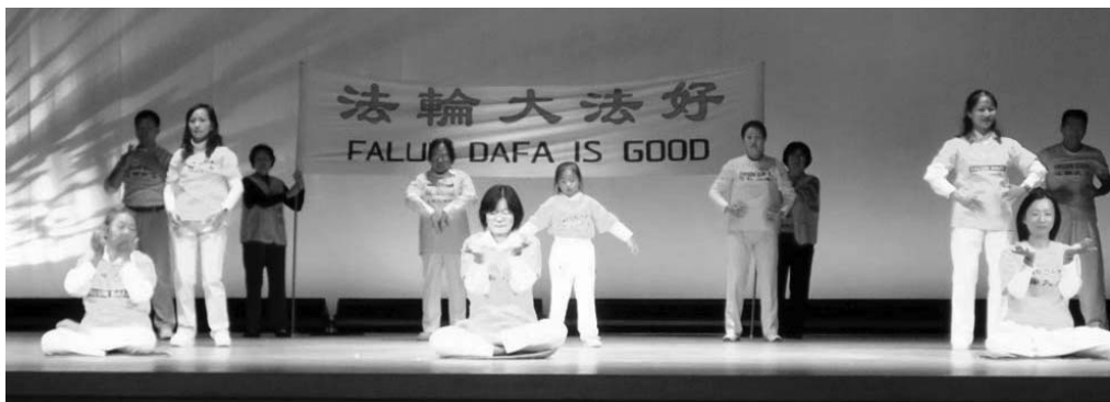
图:法轮功学员在文化节的舞台上演示功法

在文化节的第二天,学员们在舞台上演示法轮功的功法之后,马上就有一位看起来很精神的老先生到展位上了解法轮功。他看了教功录像后,马上就买了一本日语的《法轮功》,说想学功。在和他的谈话中,学员们得知他今年已经九十二岁了,问他