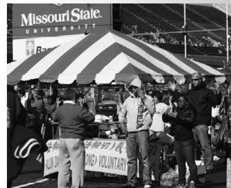
图:现场学炼法轮功

在游行结束后的各社团和学院的展览上,法轮功免费教功的展位吸引了很多人,人们对法轮功平和优美的功法很感兴趣,当场就学起了动作。很多美国学生都对第五套功法感