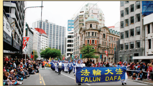
新西兰首都圣诞游行 法轮功受欢迎 (第七版)