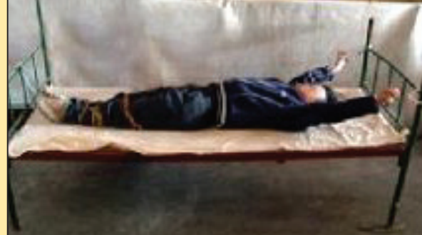
累遭酷刑凌虐 幼儿园女教师被迫害致死 (第六版)