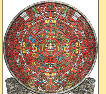
神秘的玛雅预言 (第八版)