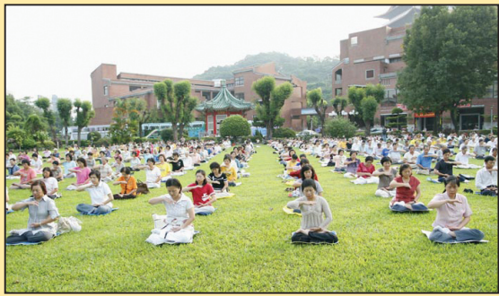
重生的喜悦 (第二版)