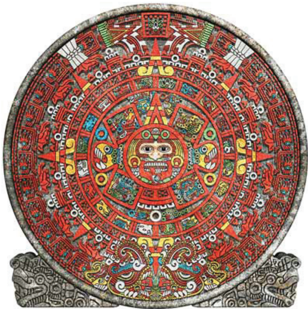
图：玛雅人的历法盘