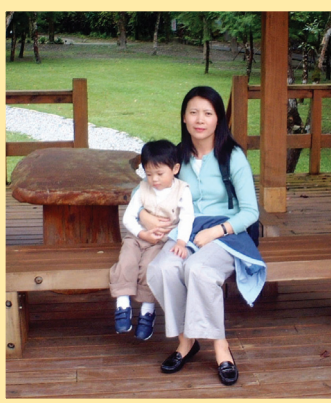
珍贵的嫁妆与传家宝 (第八版)