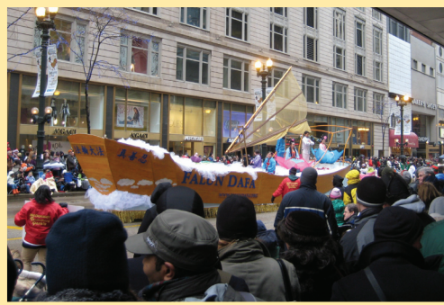
芝加哥感恩节大游行 法船载来希望(第七版)