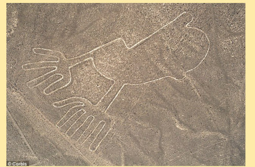
古纳斯卡文明消失之谜新解的启示(一)(第八版)