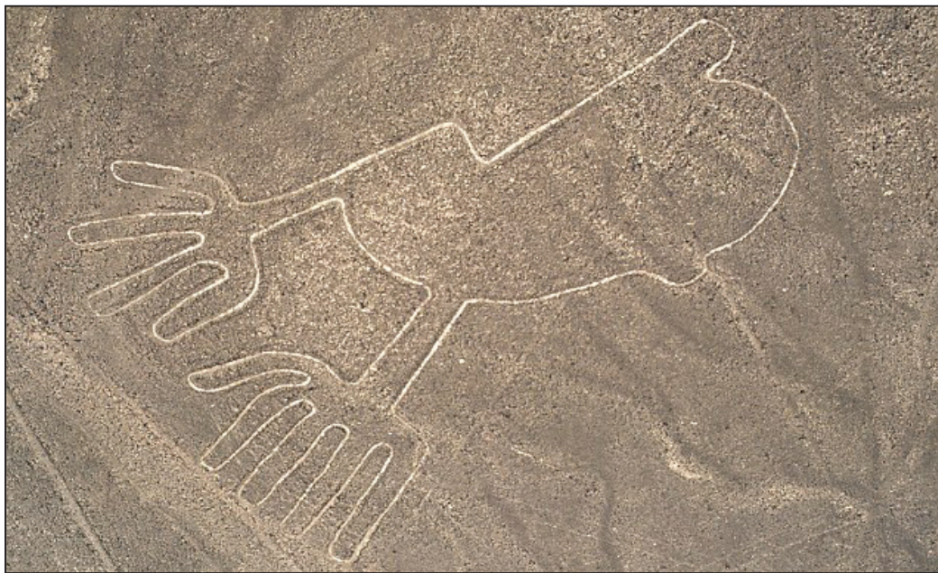
图：从天空看到的蚀刻于贫瘠沙漠中的两只大手

关于“纳斯卡线”维基百科是这样写的：位于纳斯卡沙漠上的巨大地面图形，纳斯卡沙漠是一座高度干燥延伸53英里（多于80公里）的高原，在秘鲁的纳斯卡镇与帕尔帕市之间。在1939年由美国考古学家Paul Kosok发现。它们被西元前200年至西元700年之间的纳斯卡文化所创造。有数以百计的个别图形，出自简单的线条，以复杂排列构成蜂鸟、蜘蛛、猴子和蜥蜴。除了从天空以外，纳斯卡线无法被认定成一致的图形。自假设纳斯卡人未能从这个有利位置看见他们的作