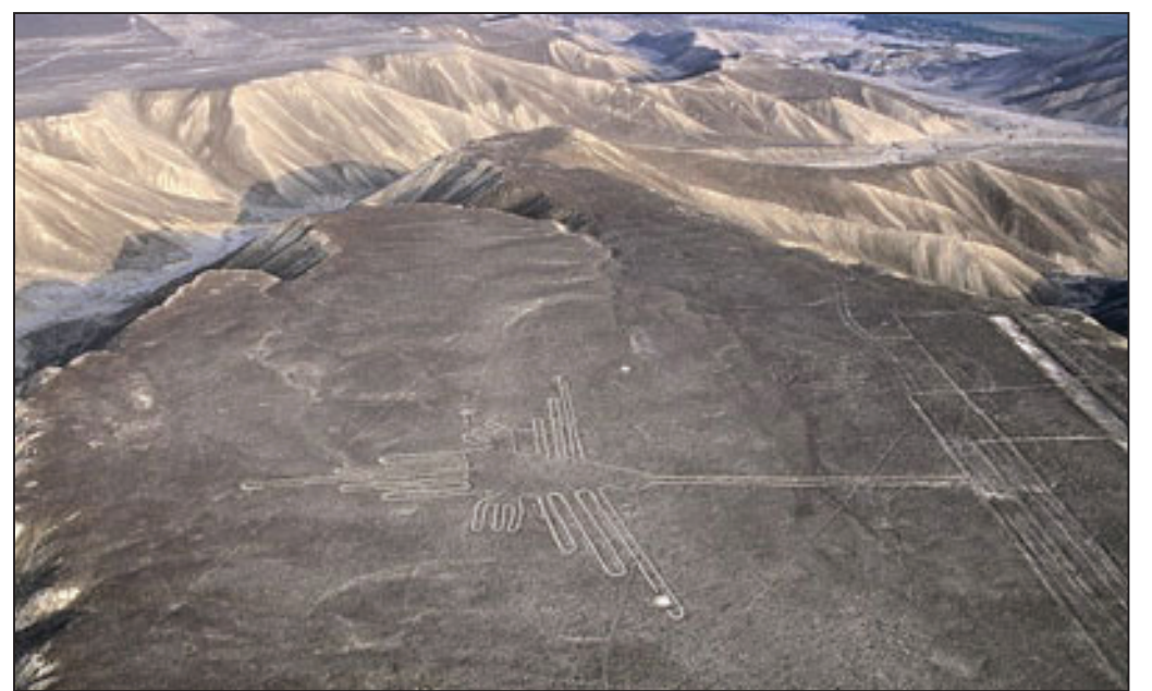
图：纳斯卡人留下的可从空中看见的巨型地画

Antiquity) 杂志上的研究报告中，科学家发现，纳斯卡人为了获得农业用地不惜将大片森林砍倒，整个过程持续了几代。结果，曾经覆盖于秘鲁沙漠地区的特有树种 Huarango 逐渐被棉花和玉米等农作物所取代。他们研究了在伊卡山谷（Ica Valley）发现的植物残骸，以揭开当地气候变化之谜。