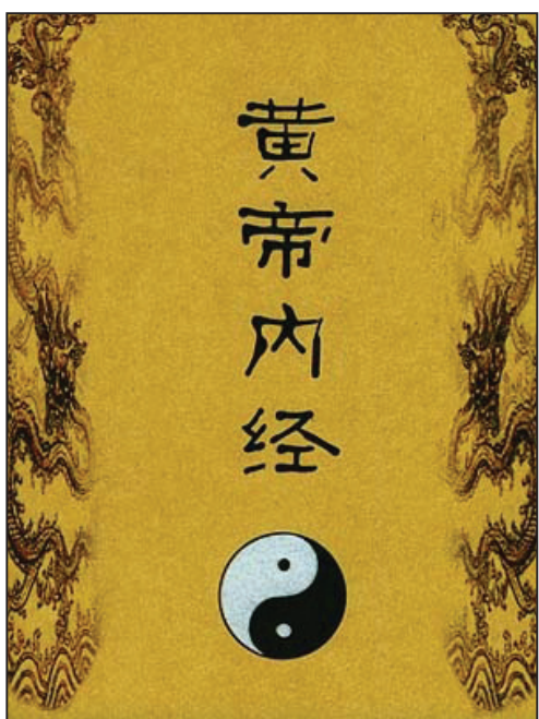
图：古代中医典籍《黄帝内经》提出了“天人合一”的观点

自然医学的一大特点在于“取法自然”，是指应用大自然提供的物质、资源、环境、条件，诸如森林、阳光、海洋、温