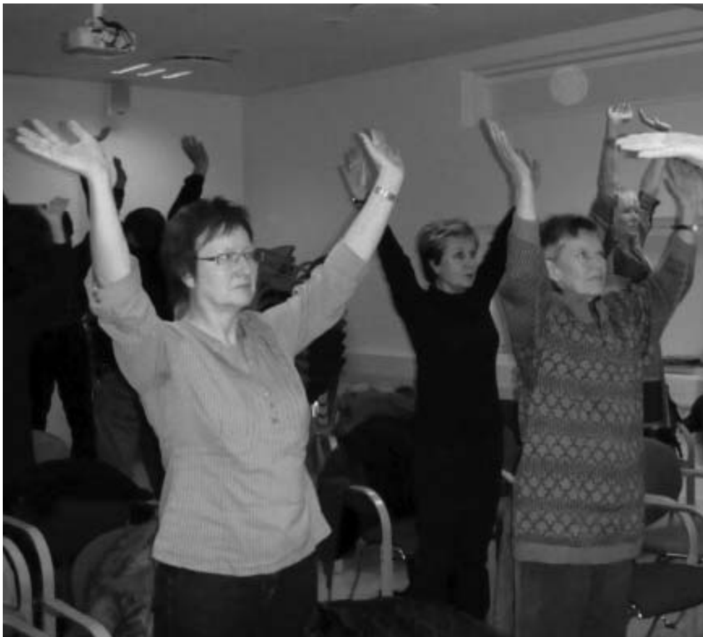
图：与会者认真学炼第一套功法

在介绍会中，学员采用了音像、投影，以及结合自己的切身感受讲述法轮大法的美好。到会的民众互动频频，不时提问，进一步了解法轮功。最后，与会者