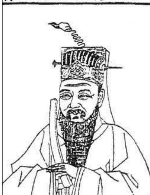
像公成文劉伯意誠師太

刘伯温相貌堂堂，慷慨而有气节。每当谈论天下大事时便形于色。太祖知道他非常忠诚，故对他委以重任。每次召见刘伯温，都要避开他人进入内室，单独与他长时间密谈。刘伯温也是知无不言。每到紧急危难的关头，他总是勇气奋发，计策立定，人莫能测。闲暇之时，便敷陈为王之道。而太祖每次都是洗耳恭听，常常称刘伯温为老先生，并说：“你就是我的张子房