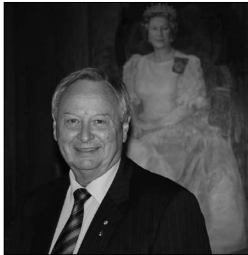
图：纽省立法委员会上议员高登·莫斯先生

自己的行为，并立即停止迫害行径。如果它（中国政府）希望得到世界人民的尊重，它必须自己去赢得别人的尊重。”