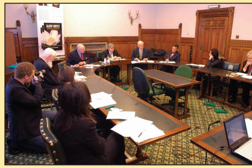
世界人权日 英国议会聚焦中共活摘器官(第七版)