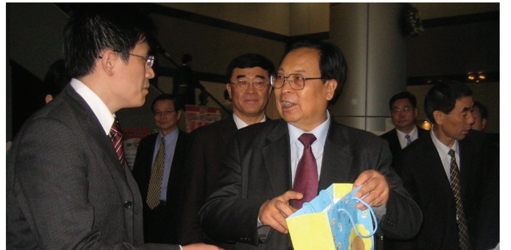
图：法轮功学员将诉状亲自递送给正在台北参访的前河南省委书记徐光春(手拿纸袋者)