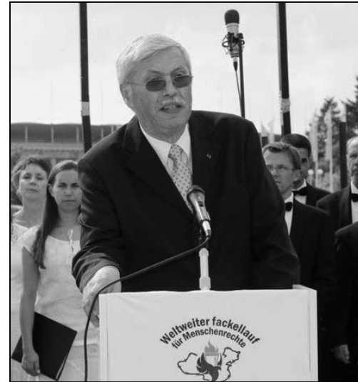
图：瓦格纳在人权圣火二零零七年八月十八日到达柏林时发表讲演，谴责中共侵犯人权的暴行。

瓦格纳说：“东德对这个地方的存在很恼火，昂纳克（前东德共产党党魁）在和西德打交道的时候，总是要求把这个地方关掉。东德总是说，这是对东德内政的干预，和中共现在说的一样。”