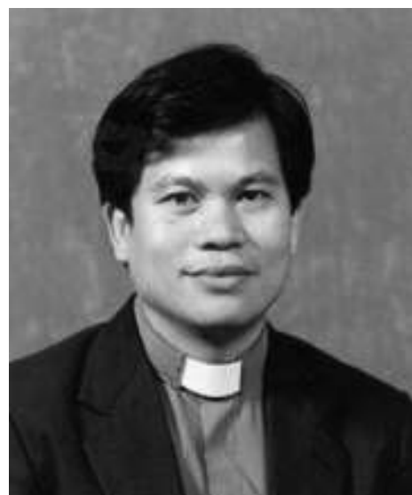
图：香港前立法局议员冯智活

省，整个国际社会都应该朝向这个目标，不要认为其他国家发生侵犯人权的事我们管不到，绝对应该去处理、主持正义。”