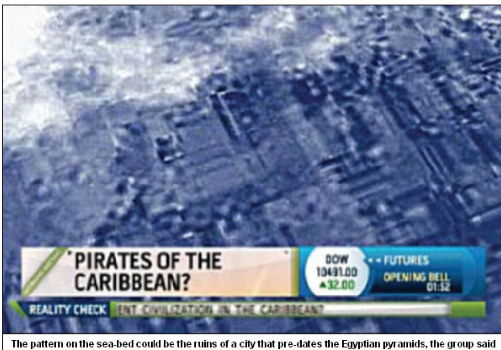
图：这支匿名科学家小组表示，这些位于海底上的结构可能是一座城市的废墟，年代可追溯到埃及金字塔建造之前。

在希腊哲学家柏拉图的描述中亚特兰蒂斯是一个美丽、技术先进的岛屿，其历史可追溯至公元前370年。他在书中写道：亚特兰蒂斯不仅有华丽的宫殿和神