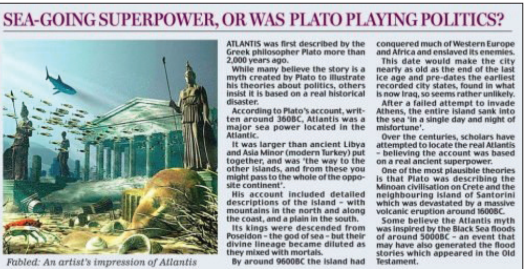
图：据这个科学家小组透露，这些照片是在加勒比海海底拍摄的，但他们并没有公布具体位置，只表示希望筹集资金进行进一步勘探。