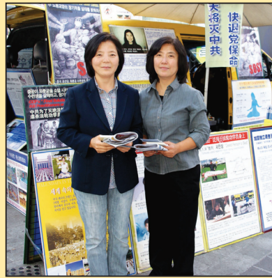
天使的心愿(第七版)