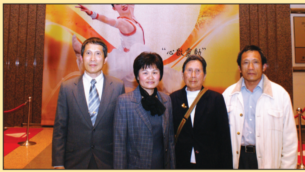
苛刻的母亲变了 凋谢的花又开了(第二版)