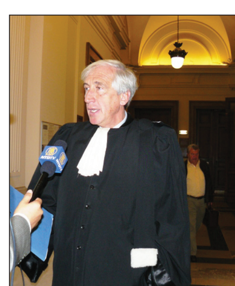
图:国际著名人权律师乔治·亨利·波杰先生

波杰先生曾与多国律师一起,成功地将前智利独裁者皮诺切特送上法庭。对于诉江案,他表示,“很高兴看到这样的结果,这说明一切都在向好的方向发展。有很多的法律条款足以起诉这些罪犯,这些人在中国还没有被绳之以法,那么就可以运用‘普遍管辖原则’在欧洲进行起诉。西班牙法庭的决定可以强化‘普遍管辖原则’来针对那些对