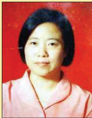
信访局副局长一家的遭遇(第六版)