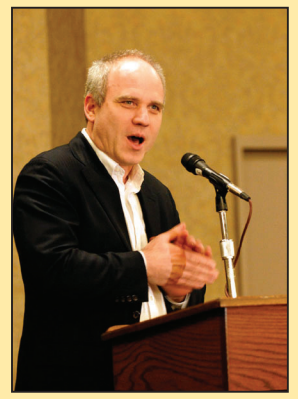
如果这就是天堂 请把 我带进去(第八版)