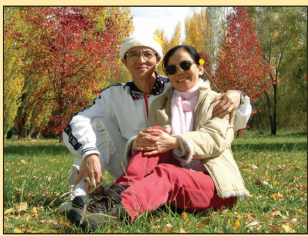
针灸医生常保健康的秘诀(第二版)