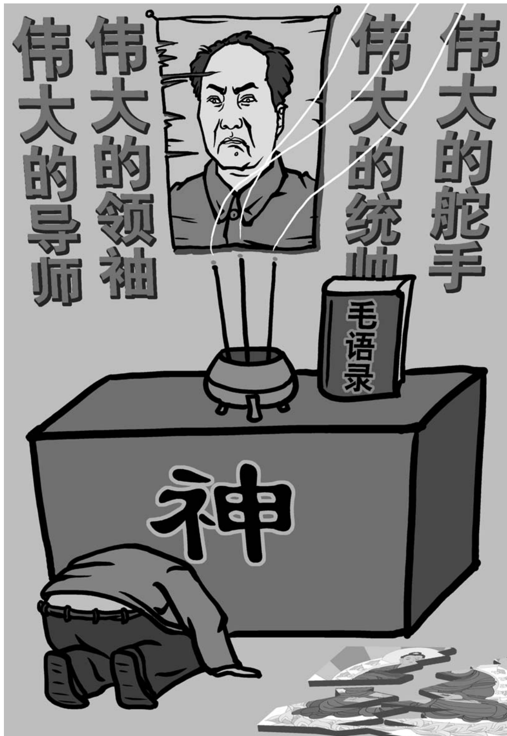
图：马克思及其在全球的徒子徒孙们，无一例外地仇恨对神的真正信仰，同时又把自己装扮得比神更崇高，这正是撒旦的特点。

实际上，中国真正的国情，就是「共产党」。世界上还没有一个共产党执政的国家能够实现国富民强，社会公平和人民安居乐业的。共产主义已经被证明是一种邪恶主义，并被世人所抛弃。虽然没有几个人真的相信共产主义，但是，不论是过去的「四项基本原则」还是现在的「四个坚定不移」，中共仍然抱着「共产党」不放。维护共产