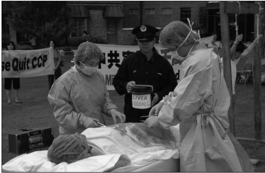
图：法轮功学员现场演示中共活摘器官的罪行

此项迫害指令由中国公安部下发至各市公安局并转到县一级，题目是《关于切实加强打击和防范……非法活动工作的紧急通知》。