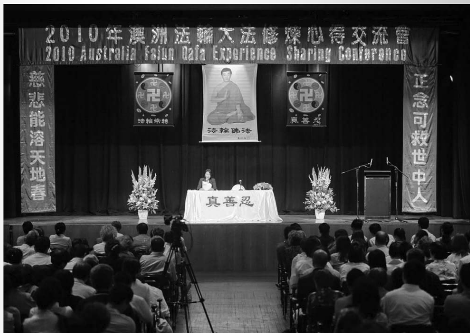
图: 二零一零年澳洲法会现场

她也说: “修炼法轮功后我感到自己越活越年轻、精力充沛! 真善忍使我对他人更加慈悲宽容。”