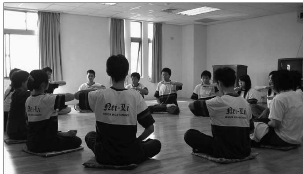
图: 内坳高中学生一起利用每星期一、三、五午休时间炼功

张校长表示, 法轮功是一种健康、平和的功法, 法轮功讲“真善忍”、教人修身向善, 教人做好事做好人, 对身心健康很有帮助。如果能从小培养孩子有“真善忍”的心境, 那是孩子未来的福气, 希望孩子透过法轮功修身养性。数周前学校开始安排课余时间让学生炼功, 结果不但在校庆时功法表演很出色, 学生在炼功过程中也有很多美好的感受。