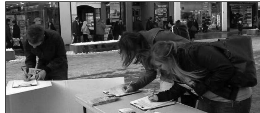
图：曼彻斯特民众在请愿表上签名

一位在哈佛大学从事多年研究工作的前中科院研究员四年前第一次看神韵是在纽约，被神韵的美好深深震撼，从此每年神韵莅临波士顿都绝不错过。他说：“从来没有见过