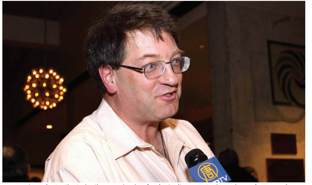
图:滑铁卢大学艺术学院院长肯·考特兹博士:这才是中国真正最美好的部份

神韵演出气势之宏大,使用服装之多,设计制作之精美绝伦,色彩之绚丽,服装色彩、面料及饰物搭配之非凡都让她觉得不可思议,她赞叹:“这绝对不来自这个世界!”