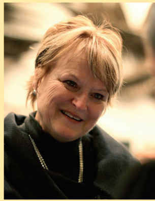
天幕把我们带到中国的千山万水(第八版)