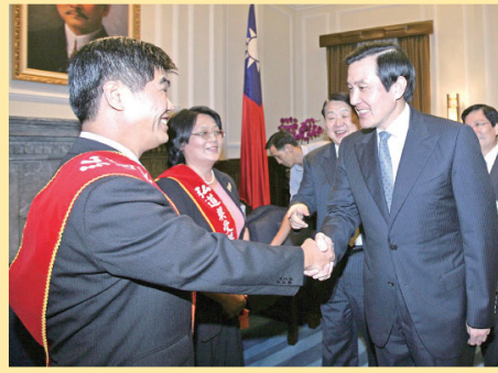
实践真善忍的教师频频获奖(第二版)