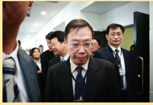
中共卫生部副部长避谈活摘法轮功学员器官(第七版)