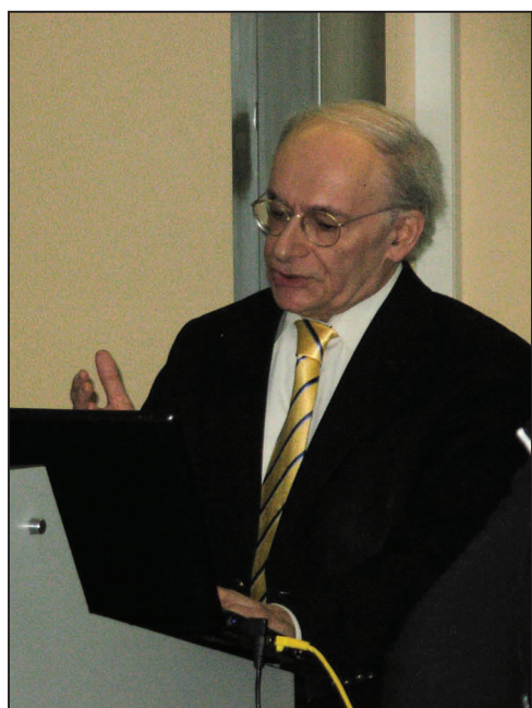
图：加拿大著名人权律师麦塔斯在颁奖会上发言

麦塔斯先生在颁奖会的发言中谈到，中共并没有减缓对法轮功学员的迫害。在他和乔高调查工作开始后，中国的器官移植手术的数量略有下降，但随后又回升了。乔高先生发言谈到，通过调查，他们