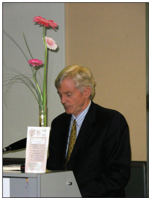
图：加拿大前亚太司司长乔高在颁奖会上发言

国际人权协会瑞士分部秘书长席勒格（Schlegel）女士表示，该协会理事会在看了乔高和麦塔斯两位人权律师关于中共活摘法轮功学员器官的调查报告及书籍《血腥的器官摘取》后印象非常深刻。“而在瑞士，还没有很多相关的公开信息。我们觉得，这份报告值得引起公众的关注及讨论，所以我们决定