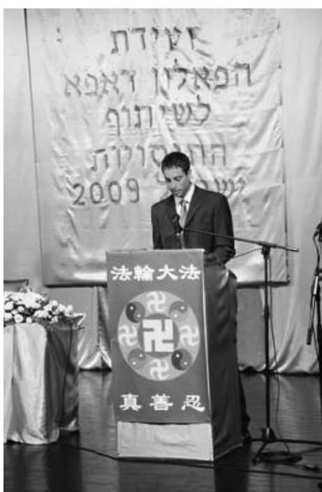
图：法轮功学员在法会上发言