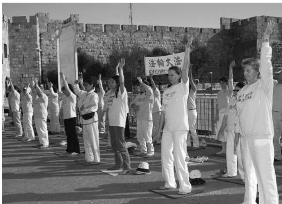
图：以色列法轮功学员在法会期间炼功