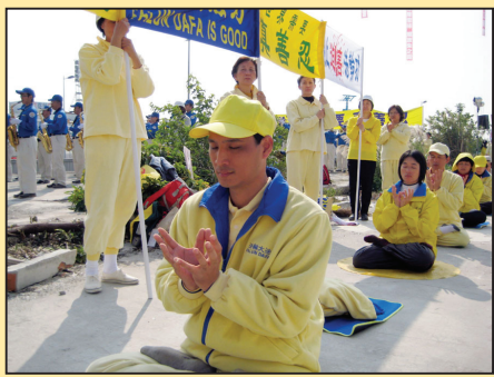
一位银楼老板的亲身体验 (第二版)