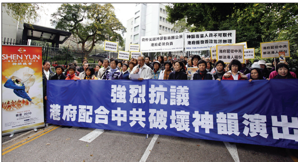
图：香港各界二十六日集会游行抗议港府阻碍神韵演出

英国上院阿维伯瑞勋爵 (Lord Avebury) 认为：中共当局是港府拒绝神韵关键技术人员签证事件的元凶。勋爵在接受《大纪元时报》采访时表示：中共当局一直没有停止对神韵在世界各地的演出进行阻挠和干扰。香港在九七回归后，根