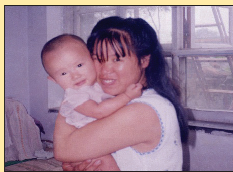
再遭绑架折磨 女教师被非法判七年半 (第六版)