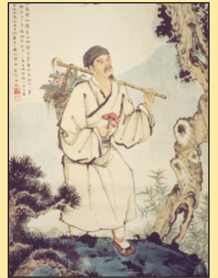
李时珍的特异功能(第八版)