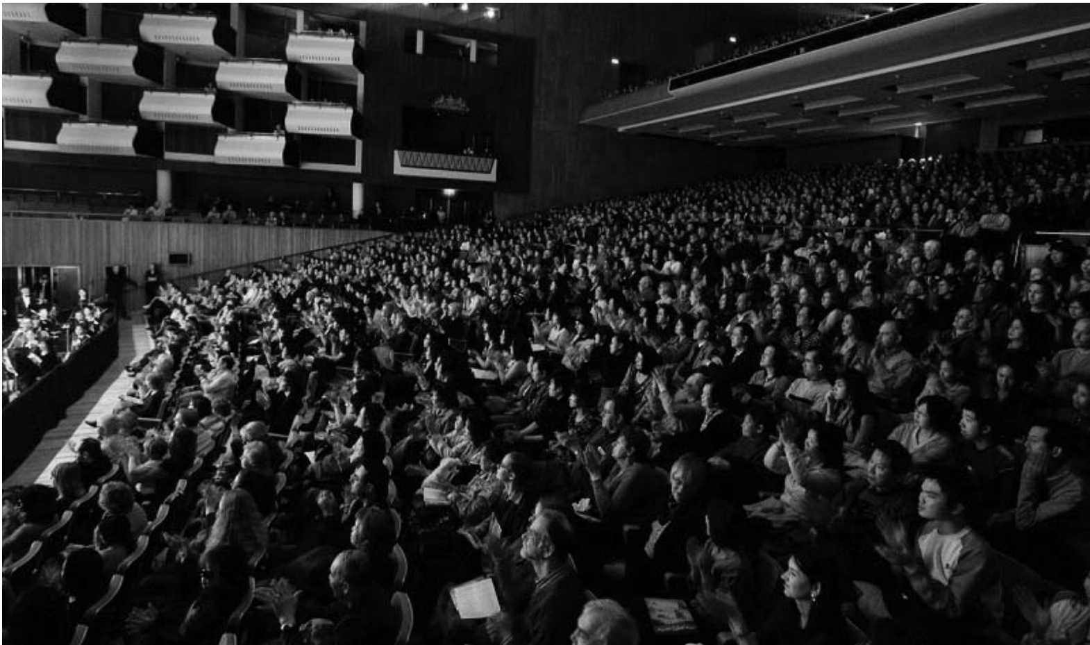
图：全球100多个城市中已经有幸欣赏神韵的上百万观众通过口耳相传，令神韵的盛名在八方流传。图为2008年2月神韵艺术团在伦敦皇家节日音乐厅的最后一场演出观众爆满的盛况。

术团关键技术人员签证，企图给人造成批准演员入港的假相。很显然港府当局知道自己做的是一件极不光彩的事情，所以鬼鬼祟祟使出这种掩耳盗铃的勾当，以图逃避外界的谴责。