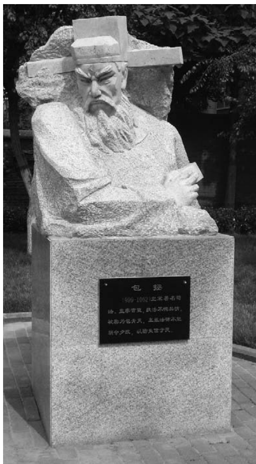
图：一心为、清正廉洁的包拯

传：他出知端州（广东肇庆）时，端州的特产——端砚闻名天下，当时的权贵、大臣、学士们都以家中存有几方端砚为荣。而包拯直到离开端州，也没有带走一方端砚。传说包拯任满后，