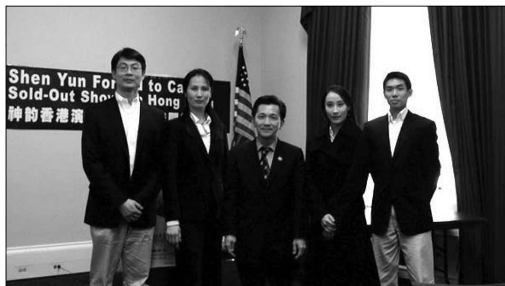
图：国会议员高光映（Anh Joseph Cao）（中）在美国国会众议院佳能（Canon）大楼举行的记者会现场与美国神韵巡回艺术团的代表合影。

美国佛罗里达州联邦众议员贾斯·毕里雷基斯（Gus Bilirakis）尤为关注神韵在香港演出受阻事件。他说：“我上周在华盛顿特区观看了神韵的演出，我去年也在美丽的肯尼迪中心观看了演出。这非凡的演出汇集了音乐、舞蹈、艺术和道德勇气。我希望神韵尽快进入香港，香港人民能在不