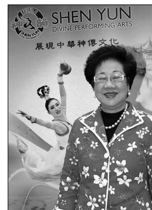
图：二零零九年二月，美国神韵国际艺术团在台北演出期间，吕秀莲观看演出，并在神韵广告海报前留影。

云林县县长苏治芬说，港府的行径想必背后一定有来自背后黑手的压力，这样的手法行径只有在极权地方才会发生。中共用“这些专业技术人员，可在香港找劳工代替”的可笑理由，施压港府拒发签证，证明中共已经黔驴技穷；更因香港执政者的屈从，已使这颗东方