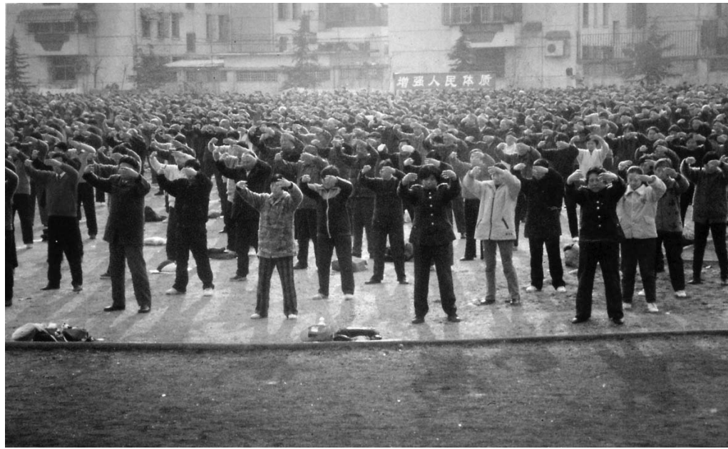
上图：一九九九年元旦合肥市大法弟子万人炼功迎接新年

除了身体健康，心性的提升家人也都感受到了，都支持她炼。十几岁的孙子从旁走过也发表他的感受：“阿嬷没修炼以前会打人，现在不会打人喔！”儿子在观察她好长一段时间后，也亲自告诉她法轮功不错，认同并支持她自愿参加讲真相的活动。