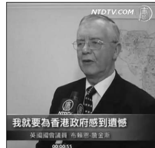
图：英国国会议员詹金斯在接受新唐人电视台采访

神韵纯善纯美的演出受到了来自不同民族文化背景观众的广泛好评。香港观众被剥夺了观看神韵的权利，詹金斯认为香港曾经拥有与英国相同的法制及民主自由，但是如今已遭破坏。