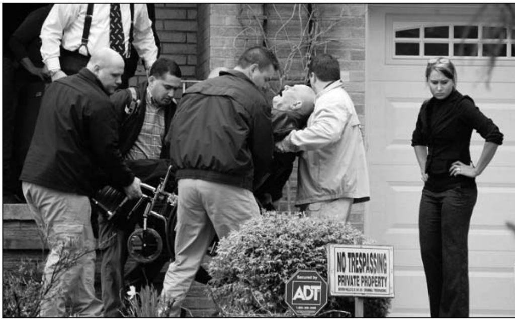
图：2009年4月14日，美国移民官员将代姆扬尤克从俄亥俄州的家中强制带走

2009年89岁的戴姆扬尤克于1943年在波兰臭名昭著的纳粹死亡集中营特里布林卡担任警卫，参与谋杀了至少2.9万名犹太人。他的工作是将被纳粹抓来的犹太人男女老幼推进毒气室。1952年他隐瞒自己真实身份，以难民身份移民美国。当他参与纳粹大屠杀的经历曝光后，1986年被引渡到以色列接受