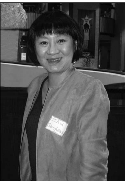
图：大学音乐系教授、钢琴家诸女士

多西方人鼓掌，我觉得好像是给我们中国人鼓掌，所以我不自觉中就坐高了一点，头也抬高了一些，可能潜意识中想让旁边的人看看，我也是中国人，他们正在陶醉的就是我们中国人的文化。平时老听外国人说中国不好不好的，这次他们的想法应该有个转