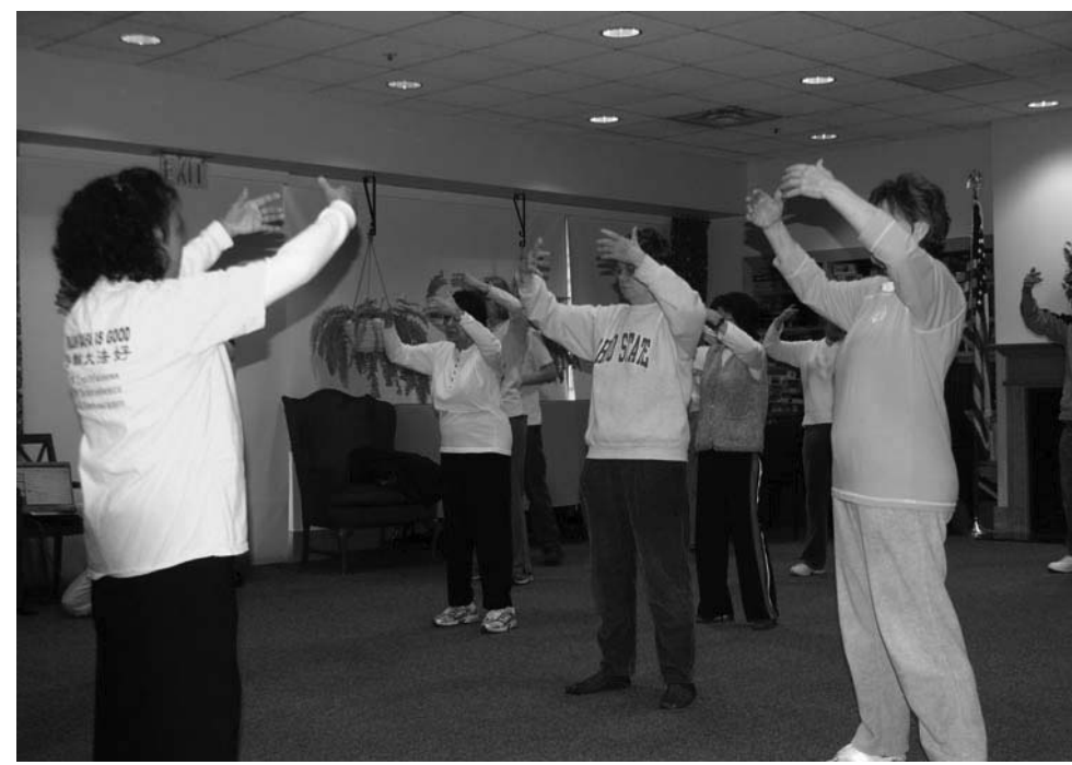
图：在学习班上教新学员炼功

修炼到十八天的时候，咳嗽彻底停止了。我修炼的信心更足了。我觉得我太幸福了。我上街赶集，别人看到我都很好吃惊：你得的病怎么这么快就好了？真是不敢相信啦！我说是真的好了，医院判了我“死刑”，法轮大法救了我的命，法轮大法太好了，你们要记住“法轮大法好、真善忍好”，会得福报的。