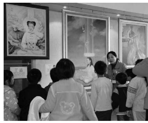
图：“真善忍国际美展”为许多人带来生命的美好