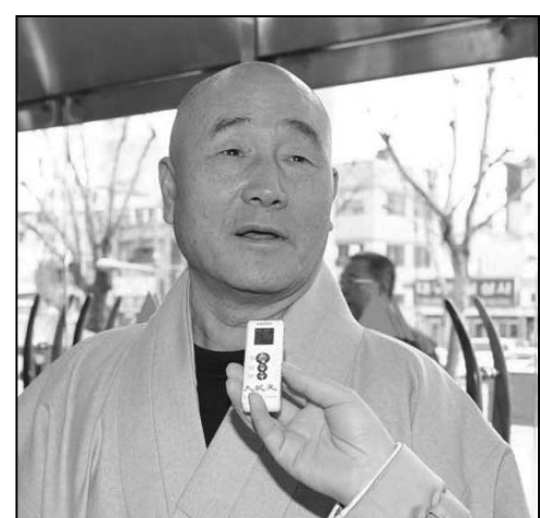
图：国际佛教元老僧会会事物总长主印道澈大僧人

作也有其意思，也能反映内心世界，可芭蕾动作很机械化。而神韵的舞蹈给人的内心世界赋予灵魂，给每个动作、每个细胞都赋予了灵魂。因此神韵的舞蹈看上去非常和善，让人觉得内心非常非常平和、幸福。神韵艺术团有着一种升华了的精神世界。他们的眼睛里，充满生机，让我铭感不尽。”