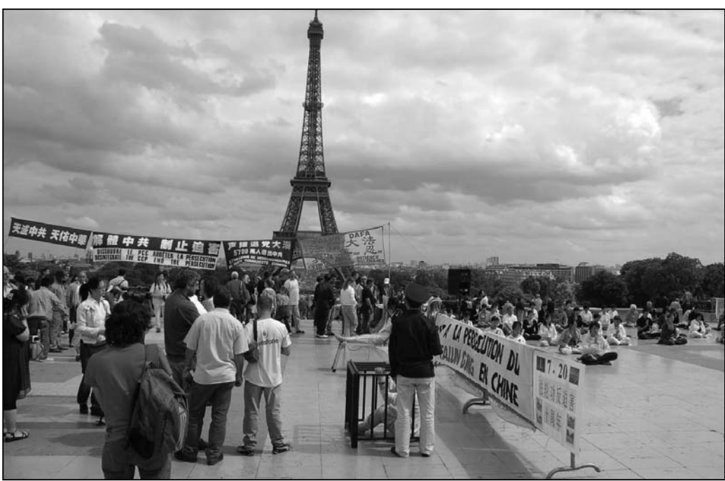
图：法国法轮功学员常在埃菲尔铁塔附近讲真相，劝“三退”（退党、退团、退队）

家长总是想把最好的东西给孩子。当知道了课文中有这样的“毒奶粉”时，我们应该如何做呢？是让孩子在无知中受其毒害，还是把基本的是非善恶标准告诉孩子，让他们从家庭教育中获得独立思考的能力，从而获得健全的人格呢？这是值得我们深思的问题