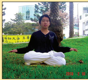
一位清华优生的故事(第二版)