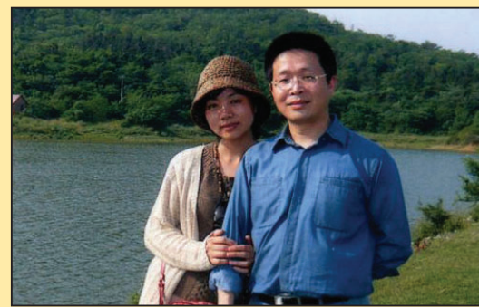
神韵演员家属失踪案提交联合国(第七版)