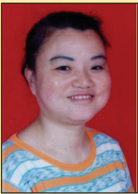
长沙法院非法庭审受害妇女(第四版)