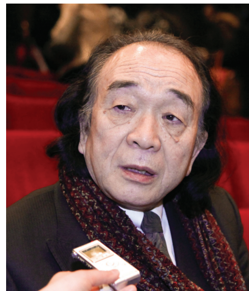
图：日本著名乐器专家矶贝宪男先生

矶贝先生是世上仅有的五位能修复“自动演奏乐器”的乐器专家中的一个。他认为：“只有拥有非常纯净的心，才能发出如此洪大的能量。如果全世界都容在这样伟大的能量中，所有人都会拥有美丽的