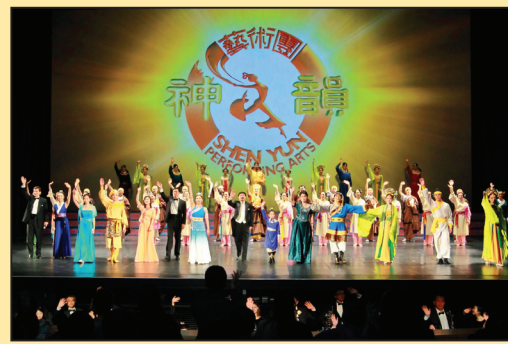
神韵艺术盛典润泽台湾七万七千人次 (第七版)