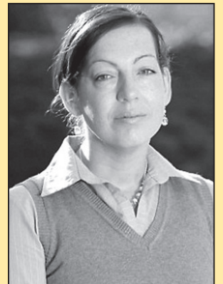
生命的记忆? 昏迷苏醒说起外国话 (第八版)